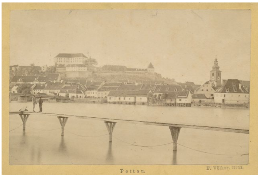
F 5: Ptuj, nabrežje Drave z vidnimi mesarskimi stojnicami, pred 1896. Pokrajinski muzej Ptuj - Ormož, fotodokumentacija