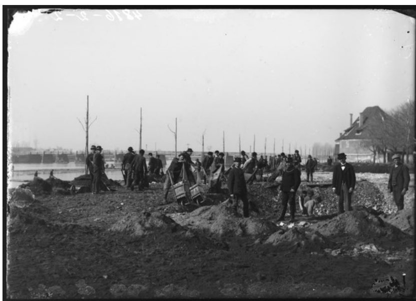
F 6: Ptuj, urejanje nabrežja Drave, 1897–1907.

301 hišo in 4257 prebivalcev. 57 Po statističnih podatkih zadnjega štetja prebivalstva v dvojni monarhiji iz leta 1910 je takrat v 360 hišah živelo 3641 prebivalcev, od tega 426 vojakov. 58 Skupno povečanje števila hiš in prebivalstva se nanaša predvsem na ptujsko predmestje Kanižo, ne pa na samo mestno jedro, ki je bilo izoblikovano že konec srednjega veka. Število enodružinskih obrtniških ali trgovskih hiš in v njih živečih prebivalcev se ni bistveno spreminjalo, saj je za gradnjo novih hiš v centru mesta