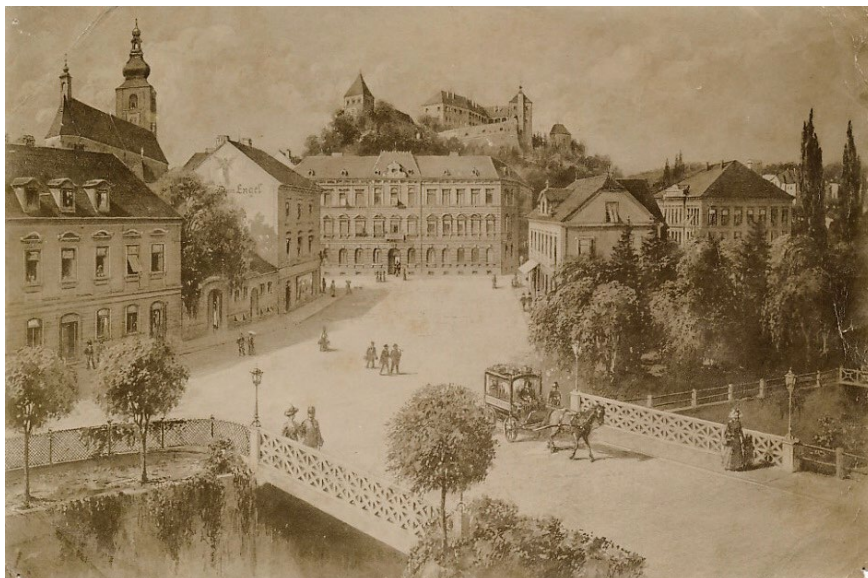
F 2: Ptuj, most čez Grajeno, ok. 1900.

ugrezanje, kajti Ogrska vrata so bila tako poškodovana, da so bila nevarna za težke vozove, ki so prečkali most. 16