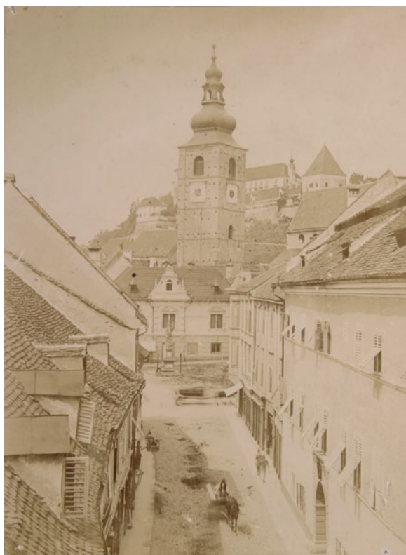
F 7: Ptuj, pogled na delno urejeno današnjo Lackovo ulico proti Mestnemu trgu, devetdeseta leta 19. stoletja.

Nineteenth century was an era of many changes occurring in the everyday life of our ancestors. Altered political, economic, social and administrative conditions had thus transformed many towns on our old continent. Numerous novelties that emerged in the 19 th century, were also adopted in Ptuj; some took a while, such as railway that was established only ten years after the opening of the Southern Railway; others came faster. Among the latter can be cited the removal of town ramparts and the filling-up of moats that started already at the end of the 18 th century and lasted until the mid-19 th century. Despite a