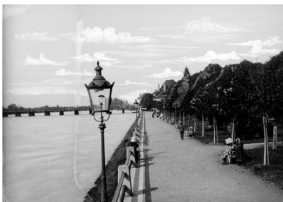
F 8: Ptuj, urejeno nabrežje Drave, imenovano Ornigovo nabrežje, po letu 1907.