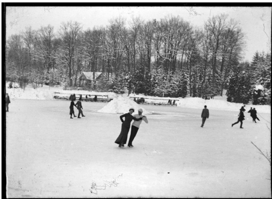
F 4: Ptuj, zimski utrinek v Ljudskem vrtu, ok. 1900.

in grmovnic so povezali z naravnim gozdom, sprehajalne poti so posuli s peskom, postavili klopi, grede med potmi in ribnikom pa posadili s cvetjem in grmovnicami. Do konca 19. stoletja je ob ribniku nastal park s Švicarijo – gostiščem, 41 kamor so Ptujčani z različnimi družbami zelo radi zahajali, saj so tam organizirali koncerte, predavanja in druge prireditve. Društvo je o koncertih poročalo v lokalnem časopisu Pettauer Zeitung . V enem od člankov so zapisali, da v Švicariji načrtujejo poletne tedenske koncerte godalne kapele Glasbenega društva na prostem. 42 Člani olepševalnega društva so v parku uredili