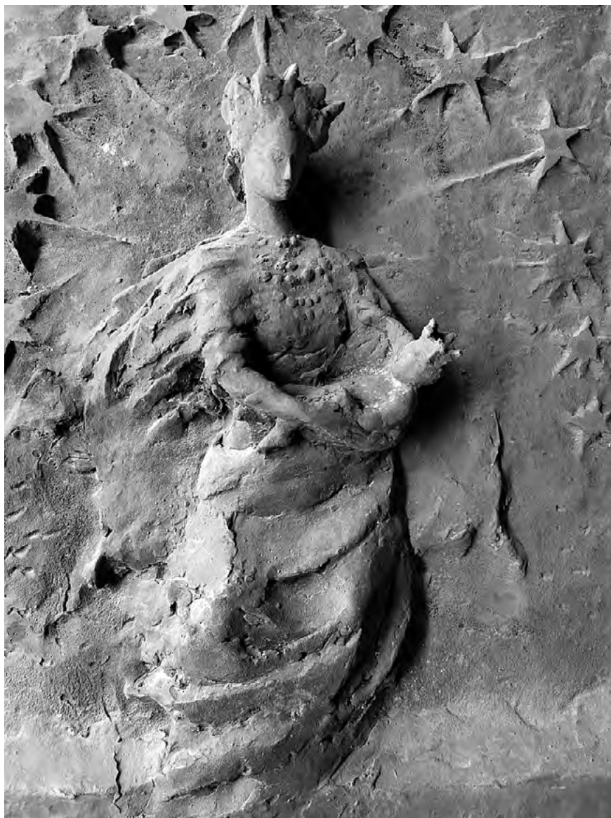
Slika 2: Bogorodica s Djetetom Isusom, detalj vratnica (foto: Tomislav Čurić)