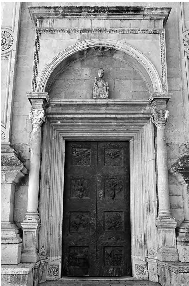
Slika 1: Nove vratnice na staroj katedrali sv. Stjepana I., Hvar