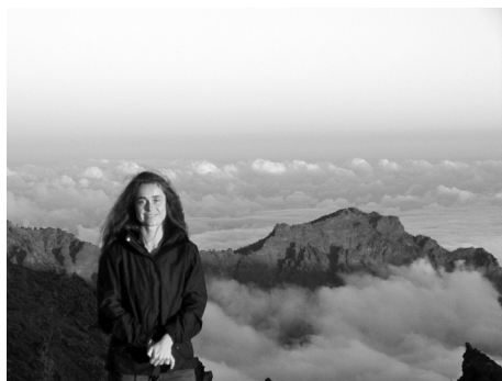
Slika 1. Vrh otoka Roque da los Muchachos na Kanarskom otoku la Palma (visina preko 2000 m).

Mi tražimo planete različitih tipova i raspona masa, metodom mikrogravitacijske leće, koristeći mrežu optičkih teleskopa raspoređenih po južnoj Zemljinoj hemisferi. Postoji nekoliko metoda kojima se danas pronalaze planeti izvan Sunčeva sustava, no problem je u tome da se uglavnom pronalaze plinoviti planeti velike mase, jer ih je puno lakše naći, što stvara poteškoće u stvaranju prave slike svemira. Stoga je upravo pronalaženje malih čvrstih hladnih planeta, odnosno planeta sličnih Zemlji, nužno za upotpunjavanje "velike slike". Prvi takav planet, OGLE 2005-BLG-390Lb pronašli smo 2005. godine. U međuvremenu smo se velikim brojem opažanja uspjeli približiti modelu "velike slike" koja, kako izgleda, kaže da planeta poput našeg ima puno više u svemiru no što se prije mislilo, te da u našoj galaksiji ima više planeta nego zvijezda (to smo objavili početkom ove godine u časopisu Nature ).