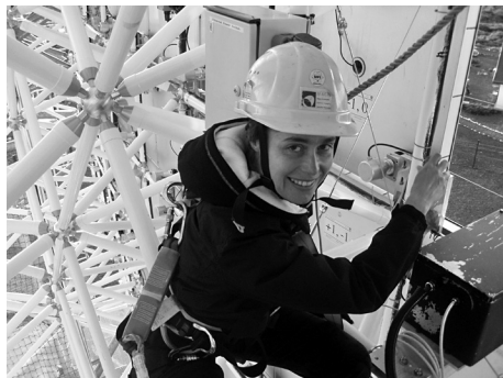
Slika 2. Popravljanje kalibracijske kutije na MAGIC II teleskopu, na visini od oko 15 m po jakom vjetru.

MAGIC (Major Atmospheric Gamma Imaging Cherenkov telescopes), zajedno s još devetoro kolega iz Hrvatske: iz Zagreba (IRB), Splita (FESB) i Rijeke (Odjel za fiziku Sveučilišta u Rijeci). U prosjeku jednom godišnje svatko od nas provede po tri do četiri tjedna u La Palmi opažajući na teleskopima ili radeći na unapređenju hardvera eksperimenta. Uz to radimo na analizi mjerenja i unapređenju softvera tijekom cijele godine. Te su opažačke smjene na teleskopima ponekad vrlo zahtjevne, jer radimo po cijele noći, na hladnoći i visini sa smanjenim udjelom kisika, no s druge strane divan je osjećaj biti na mjestu gdje vidiš super-bistro zvjezdano nebo, oblake gledaš odozgo, i uživaš u tišini prirode, okružen malim brojem ljudi, većinom entuzijasta.