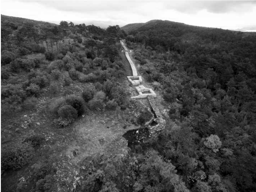
Sl. 9. Slika snimljena dronom za vrijeme istraživanja 2017. na Solinu iznad Kostrene

organizaciji HRZ-a. Arheološka baština je na tim lokacijama zatim konzervirana i prezentirana (postavljene su ili će biti postavljene informativne ploče te su lokacije u Sloveniji na Ajdovskom zidu dio poučne staze „Put uz rimski zid“). Provedeno je više volonterskih akcija čišćenja u Sloveniji i Hrvatskoj, u kojima je sudjelovalo lokalno stanovništvo te tako pomoglo sprječavanju daljnjega obrastanja zidova.