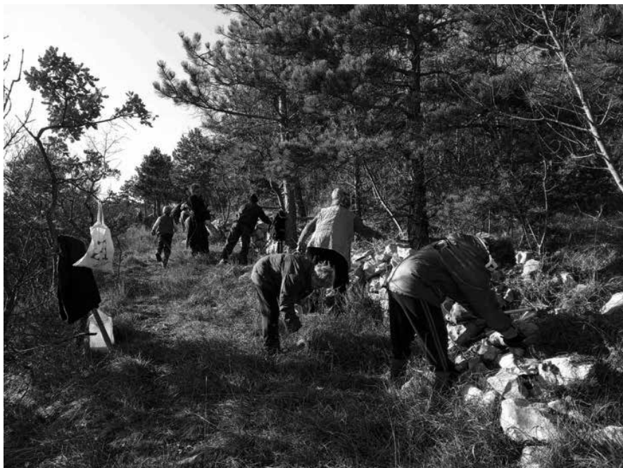
Sl. 11. Slika s akcije čišćenja na Jelenju 2019.