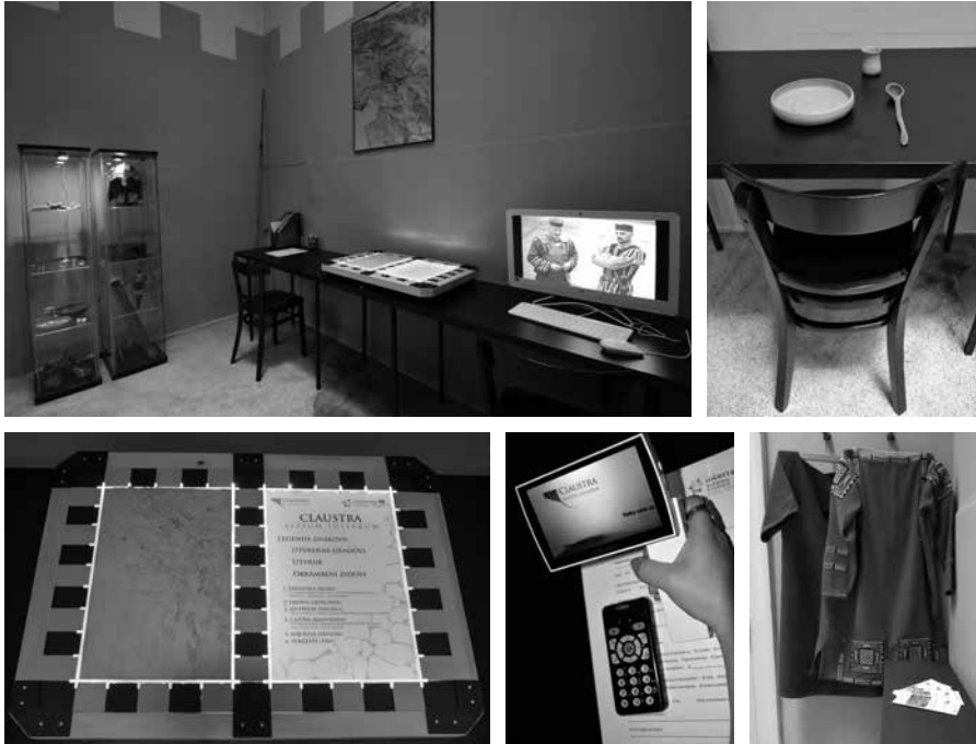
Sl. 12-16. Treća prostorija didaktičke obavijesne točke Claustra u Pomorskom i povijesnom muzeju Hrvatskog primorja

njihovi drugi vodiči i publikacije, diktafon za snimanje sadržaja (mi korisnicima, ali i korisnici nama ili sebi) i digitalno povećalo za slabovidne.