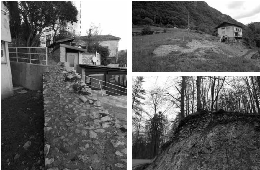
Sl. 6-8. Snimci zatečenoga stanja na terenu

zarastanje nekadašnjih pašnjaka, nepropisno bacanje otpada na ili u blizini CAI -ja, a u prošlosti je CAI bio i izvor građevinskoga materijala uzimanjem kamena za gradnju obližnjih kuća. Uz to, CAI ni danas nije na svim segmentima zaštićen kao kulturno dobro. Dodatna otežavajuća okolnost je da onuda prolazi državna granica Slovenije i Hrvatske, koja je ujedno i granica područja Šengenskoga prostora i na kojoj je 2017. postavljena žičana ograda, koja je kod Prezida postavljena i na samu liniju CAI -ja. 14