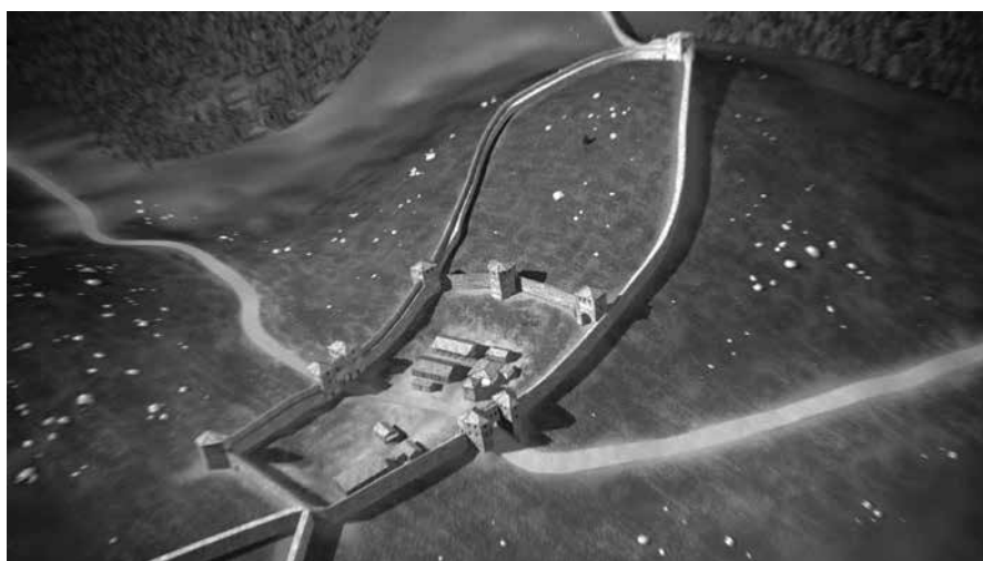
Sl. 1. Trodimenzionalna digitalna rekonstrukcija tvrđave Ad Pirum na Hrušici, gdje se vidi početak širenja krakova linijskih zidova od tvrđave dalje u prostor (Narodni muzej Slovenije)

Na strateškim mjestima, uglavnom na povišenom terenu iznad cesta, bile su postavljene manje utvrde, dok su gradovi koji su bili uključeni u sustav CAI -ja, kao što su npr. Tarsatika i Ad Pirum, bili dodatno utvrđeni gradskim bedemima. Od bedema su se širili linijski zidovi CAI -ja. Tako se od tvrđave Ad Pirum šire dalje četiri linije različitih duljina, dok se od Tarsatike pruža samo jedna, koja se preko Kalvarije i Kozale diže prema