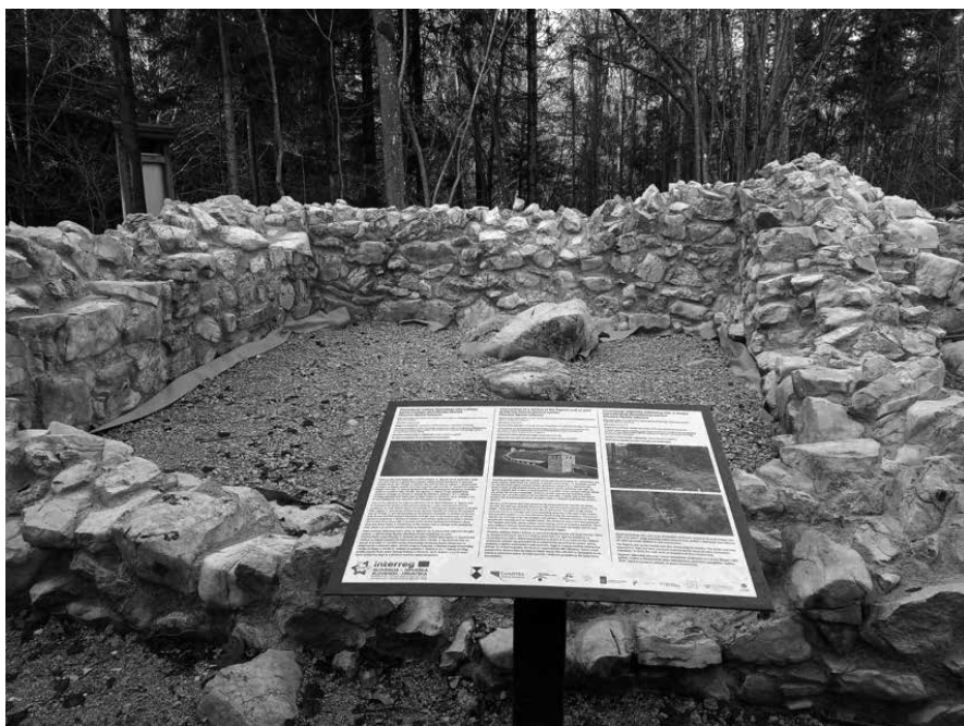
Sl. 10. Slika kule na Ajdovskom zidu s informativnom pločom