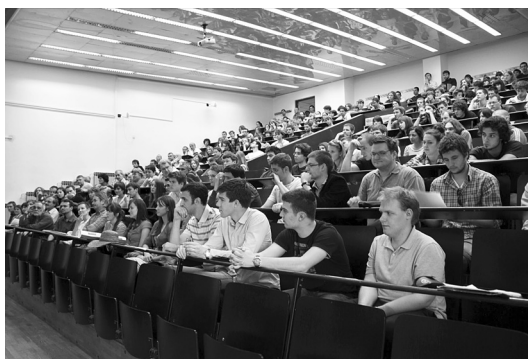
Najveća dvorana na Matematičkom odsjeku bila je prepuna.