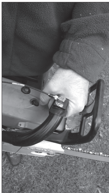
Slika 4. Montaža akcelerometra na motornu pilu Figure 4. Mounting an accelerometer on a chainsaw

Mjerenje je napravljeno u 3 navrata po 20 sekundi. Radni zahvati rezanja motornom pilom mjereni su pri konstantnom radu rezanja unutar 20 sekundi. Rezanje se provodilo naizmjenično s gornjom i donjom stranom vodilice da bi se izbjeglo snimanje razine vibracija u praznom hodu koje je obuhvaćeno u ostalim radnim zahvatima. Prilikom mjerenja akcelerometar je na ručke motorne pile bio montiran pomoću nosača UA 3017 (slika 4); (Bačić, 2019.).