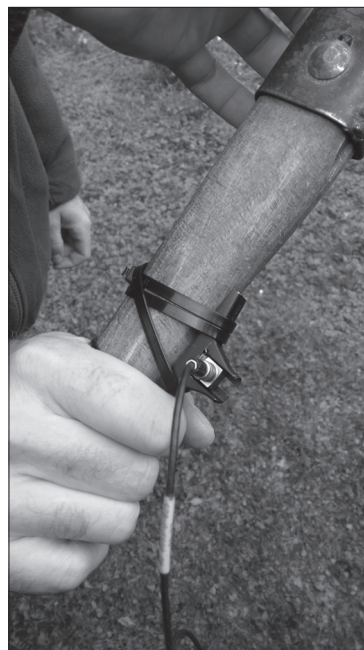
Slika 3. Montaža akcelerometra na kosir