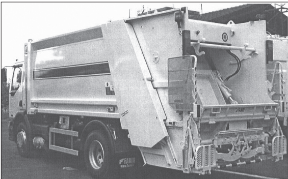
Slika 1. Komunalno vozilo

Tijekom skupljanja komunalnog otpada u jednoj od ulica, radnik A.A., zaposlen kod poslodavca X.X., vozio se s ostalim radnicima na papučici komunalnog vozila prema sljedećoj lokaciji prikupljanja otpada. U jednom momentu, tijekom vožnje, radnik A.A. je pao s vozila te je zadobio višestruke teže ozljede glave i trupa, zbog kojih je naknadno preminuo u bolnici.