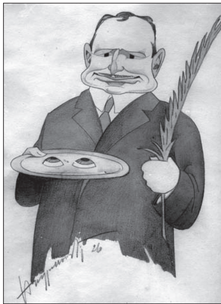
Slika 2. Dr. Juraj Ćurin, osnivač Očnog odjela u Splitu. Naslikao ga je kao sv. Luciju splitski karikaturist Angjeo Uvodić 1926.