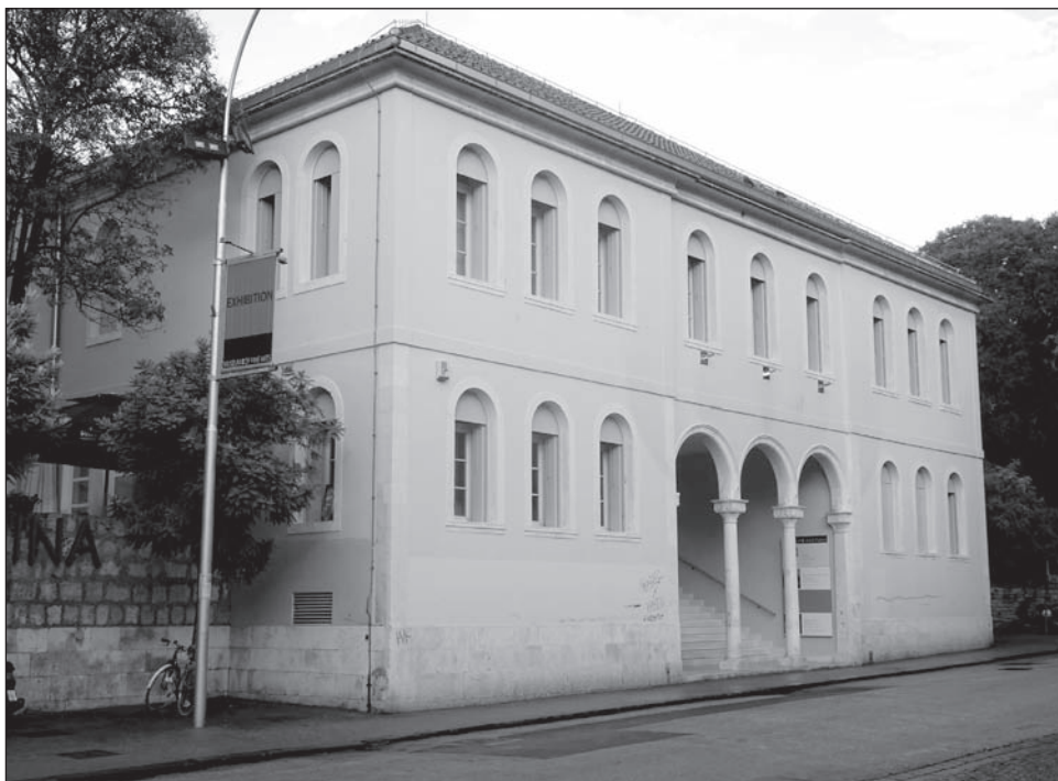
Slika 1. Pročelje stare splitske bolnice

Civilnu bolnicu u Splitu osnovala su braća Ergovac 1797. godine. Smještena je unutar bastiona Corner. 3 Kontinuirano je radila na tom mjestu sve do 1977. kada se i posljednji bolnički odjel preselio u novu bolnicu na Firulama.