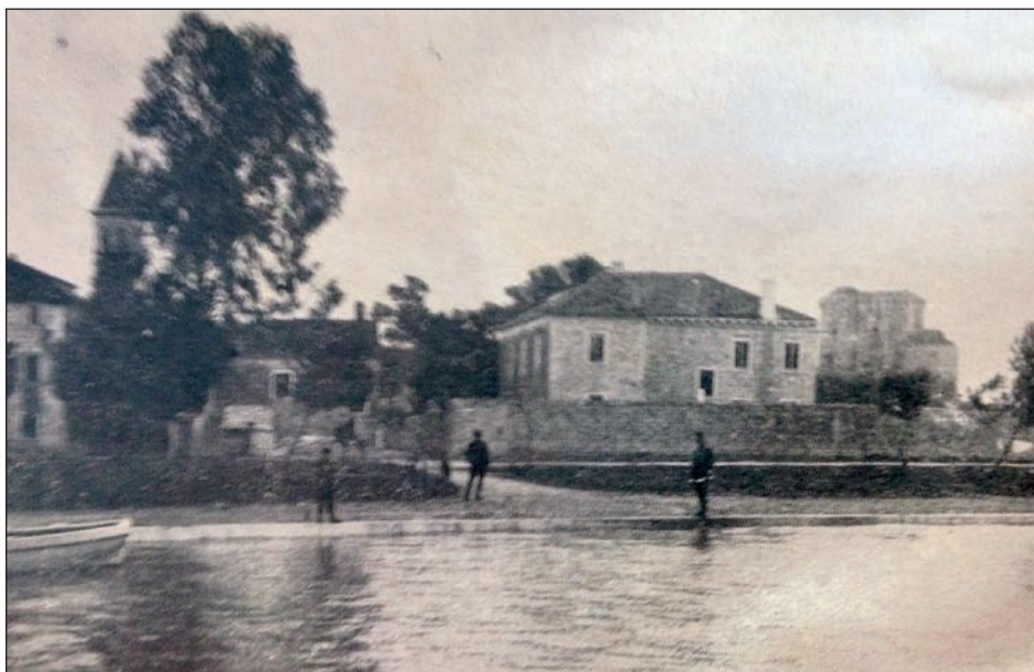
Slika 3. Institut za proučavanje i suzbijanje malarije u Trogiru