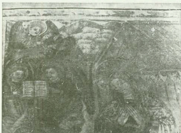
4. Rođenje Kristovo. Freska u crkvi Sv. Marije od Lokvića u Dvigradu, Istra, oko 1470—1484.

Jedan detalj, svirka kostura klastog gajdaša, daje cijelom prizoru folklorni ugođaj, pogotovo ako uzmemo u obzir da su na seoskim sajmovima i zabavama često svirali kljasti prosjaci moleći milostinju. Iako gajde na ovom folklornom području ne postoje s bordunskom sviralom, (trubanj) nego bez nje, kao prije XIII st. te se zovu »mih« i slično, čini se da je majstor osjetio da su gajde savršene od miha, zbog borduna, te im je u likovnoj obradbi dao prednost pred mihom. Međutim, tome može biti i likovni razlog (čudan položaj borduna) a i kombinacija iz nekoliko predložaka. Uostalom, nedostatke predložaka slikar je nadomještao sličnim vizuelnim predodžbama iz vlastite sredine, što je očito u držanju gajda poput miha.