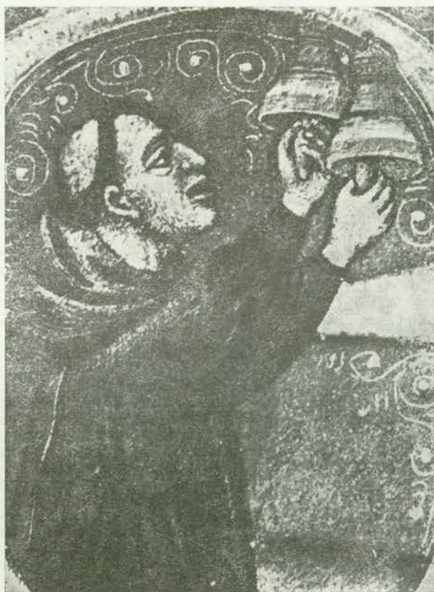
5. Svirač zvona. Breviarij, fol. 88, lokalna prepisivačka radionica, XV st. Rab, (Kampor), franjevački samostan.

pregnut vrat. Međutim, ako se smatra da je taj način dobivanja tona na zvonu neobičan i neprikladan uz pjevanje, čini se, da bi ta minijatura zapravo mogla prikazivati ono tzv. »kampananje«,