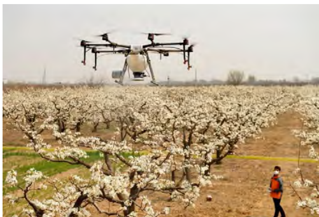
Slika 2. Dron

Tehnologije u poljoprivrednoj proizvodnji predstavljaju velik udio i njihova će uloga u budućnosti stalno rasti. Primjena dronova (slika 2), robotike, senzora i preciznih tehnologija pomoći će proizvođačima povećati produktivnost, a smanjiti fizički rad. Iako su neke od spomenutih tehnologija već prisutne u poljoprivredi, njihova je primjena još uvijek vrlo mala. Pomoću drona lako se može utvrditi situacija u polju jer dron nadlijeće parcele i javlja proizvođaču što se događa sa štetnim organizmima, ima li nedostatka mikro ili makroelemenata u biljkama i sl. Osim izviđanja dron može obaviti preciznu aplikaciju sredstava za zaštitu bilja ili gnojiva na vrijeme, tj. onda kada je to biljci doista potrebno. U sustavu zaštite bilja protiv štetnika i bolesti tendencija je da se tretira samo dio polja koji je napadnut, a s vremenom samo biljka ili pojedini njezini dijelovi (ako je napadnut list, tretirat će se samo list).