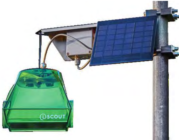
Slika 4. Elektronički trap za praćenje populacije štetnih kukaca ( https://www.google.hr/search?q=metos+iscout&safe=active&sxsrf=AleKk01AlG3ikffiKXI98VJPriegVcklfw:1598551927324&source=Inms&tbm=isch&sa#imgrc=F6gsPkgS5L6WOM )