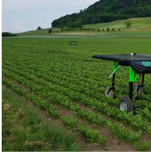
Slika 3. Pametni stroj sa senzorima

konfuzije u kojoj primjenom seksualnih feromona mužjak ne može oploditi ženku bit će sve prisutnija u svim kulturama za suzbijanje štetnih gusjenica.