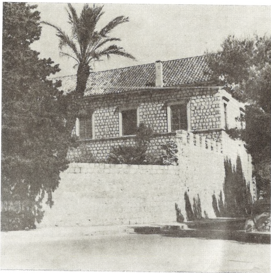
Knežev dvor u Cavtatu

sačuvani regulacioni plan Cavtata, naime plan dodataka s oznakom vlasnika, odnosno naslovnika decena (desetine) i s rasporedom ulica, nalazi se u biblioteci Male braće u Dubrovniku. Sačuvani primjerak plana ne može biti iz 1427, pa niti iz 1471, već istom iz druge polovine XVI stoljeća. Naime, na planu se vidi i gradski zid s kulama i kuća kapetana naslonjena na zidine. Kako smo vidjeli, kule su građene 1452, a Dvor (kuća kapetana) građen je istom 1555 — 1558. godine. Spomenuti plan jedino može biti kopija staroga plana iz 1427, na koju je onaj koji ga je precrtavao, gledajući očima XVI stoljeća, ucrtao i objekte, koji su u njegovo doba postojali, pa ako ih u originalnom planu i nije bilo. Raspodjela ulica na tom planu uglavnom odgovara sadašnjem rasporedu.