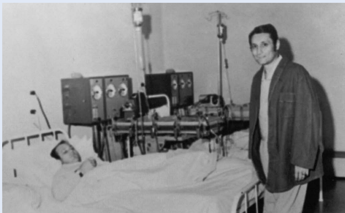
Slika 5. Prvi pacijent s transplantiranim bubregom u Rijeci posjećuje drugog pacijenta na hemodijalizi i ohrabruje ga da slijedi njegov primjer.