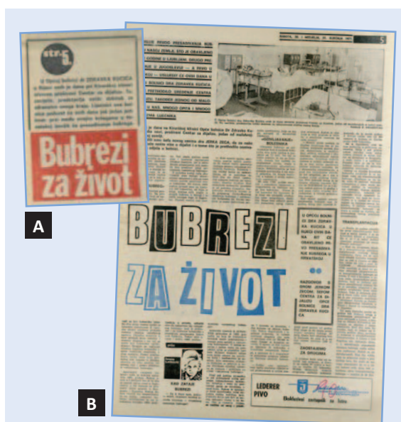
Slika 6. Novi list je na sam dan transplantacije na naslovnicu najavio prvu transplantaciju bubrega (A) uz članak na petoj stranici (B).

1. Želja profesora Frančiškovića bila je da se prva transplantacija izvede u miru, bez znanja javnosti. Zamolio je novinarku Novog lista, koja je vodila zdravstvenu rubriku, da o događaju piše tek nakon što se odigra. Problem je bila činjenica da Novi list nije izlazio nedjeljom. Posljedica bi bila da vijest objave ostali listovi ranije od lokalnog glasila. Rezultat toga bio je da je u subotnjem No-