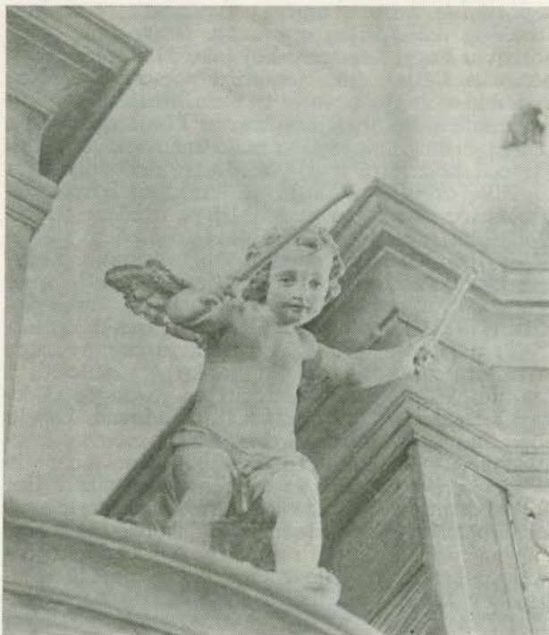
Kutina, umjetnički detalj s orgulja (oko 1777.)

Od novijih orguljara, osim tvrtke Heferer (pregledano 20 orgulja), najzastupljeniji je J. Brandl iz Maribora (14 orgulja), od kojih je na žalost napadno veliki broj u vrlo zapuštenom stanju, no razlozi ne leže u nekvalitetnom radu već u prilikama i uvjetima. Najljepše su mu orgulje u pav-