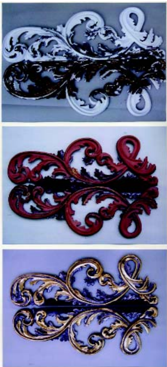
Oltar Sv. Antuna Padovanskog, (17.st.), Rkt župa Kraljice Sv. Krunice, Remetinec Fotografije: Rekonstrukcija lateralnih ukrasa s atike: nakon krediranja i bolusiranja te nakon provedenih postupaka pozlate i posrebrivanja