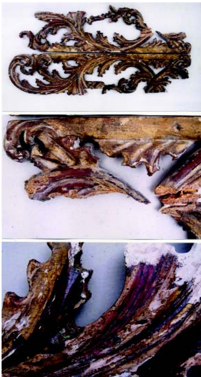
Oltar Sv. Antuna Padovanskog, (17.st.) Rkt župa Kraljice Sv. Krunice, Remetinec Rekonstrukcija pozlaćenog ukrasa s atike – 2 kom. (spajanje razljepljenih dijelova, impregnacija drveta, dezinfekcija, čišćenje, podljepljivanje polikromije, kitanje, rekonstrukcija, krediranje, retuš). Fot: 1.i 2. - ukrasi prije rekonstrukcije dijelova; fot. 3. - stanje izvorne pozlate