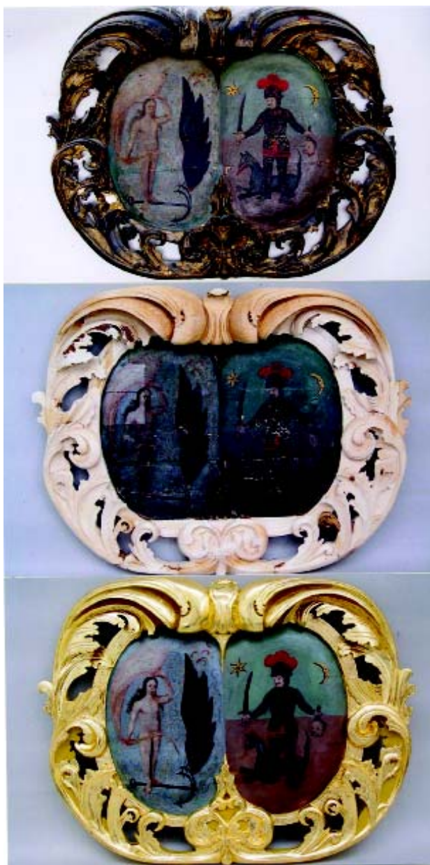
Oltar Sv. Antuna Padovanskog, (17.st.), Rkt župa Kraljice Sv. Krunice, Remetinec Grb baruna Baltaraza II., Patačića i njegove žene Terezije Gereczy prije, u tijeku i nakon recentnih rekonstrukcija mnogobrojnih dijelova u drvetu, a koji su bili nadoknađeni u gipsu