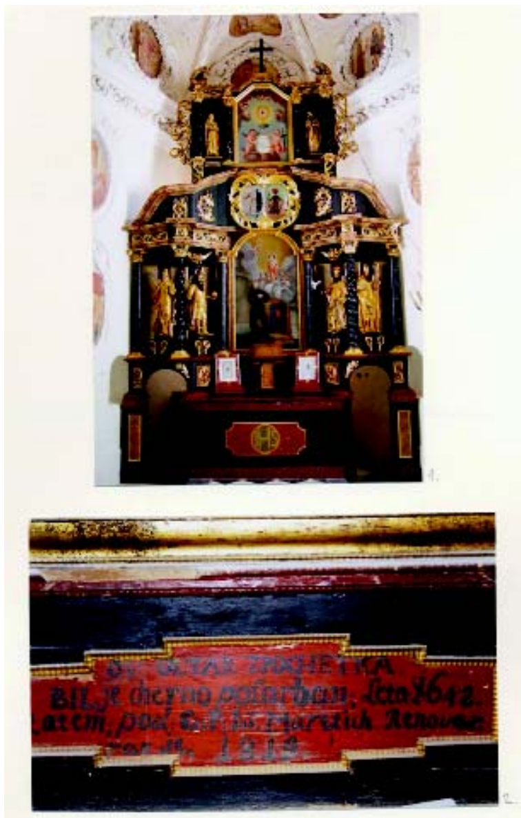
Oltar Sv. Antuna Padovanskog, (17.st.), Rkt župa Kraljice Sv. Krunice, Remetinec Fotografije: 1.Oltarna cjelina nakon provedenih konzervatorsko-restauratorskih radova; 2.Tekst s predele oltara: "OV OLTAR ZPOCHETKA BIL JE cherno pofarban; Leta i642. zatem; pod: G. P. : Ioš. Maretich. Renover, ran je, i8i9."