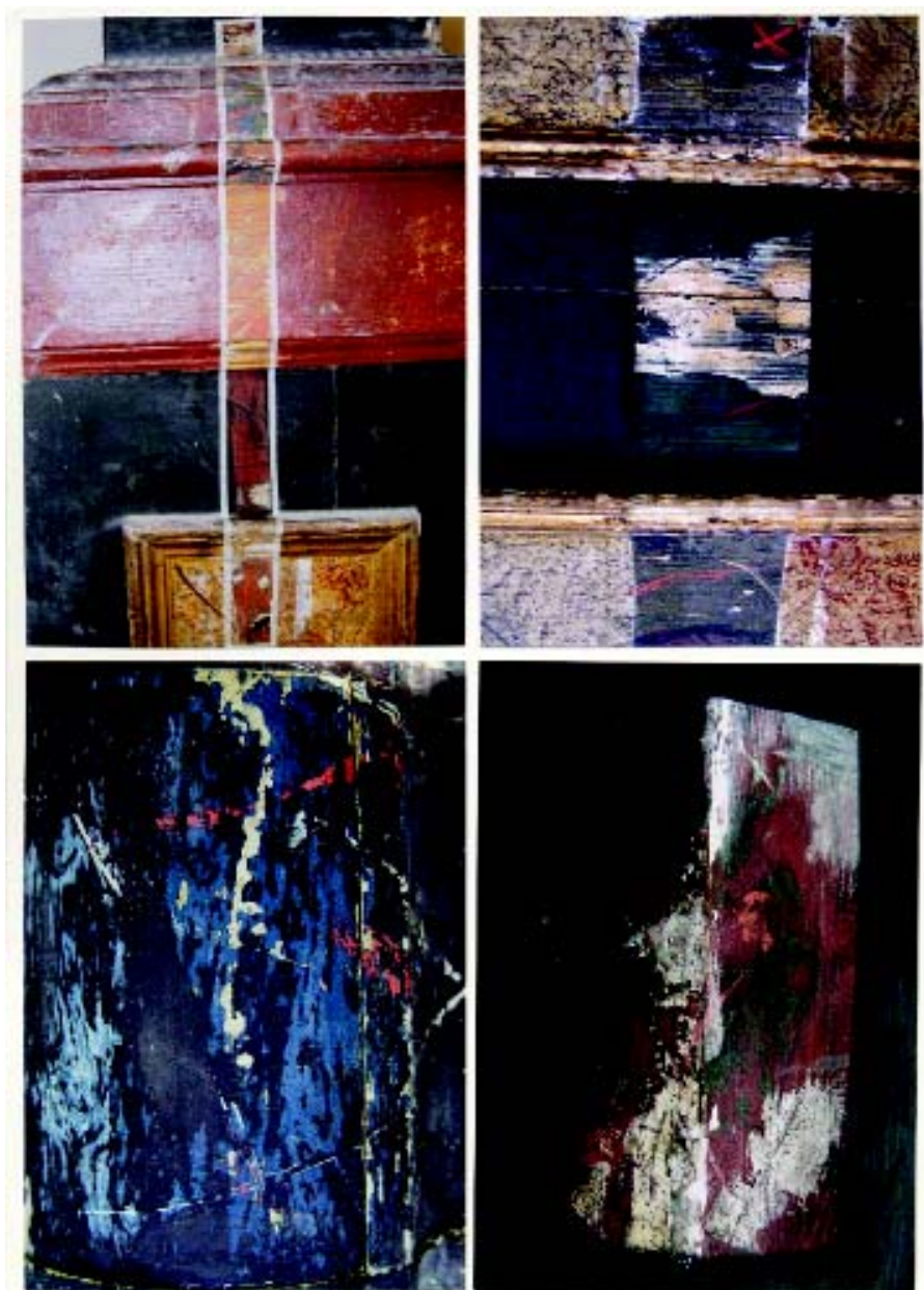
Oltar Sv. Antuna Padovanskog, (17.st.), Rkt župa Kraljice Sv. Krunice, Remetinec Fotografije: Arhitektura oltara – sondiranja polikromnog sloja: 1. sonda preko profilacije i uklade lijevog dovratnika; 2. sonda uklade s oltarnog krila; 3. sonda s baze skulpture; 4. sonda sa segmentnog ukrasa u zoni kartuše