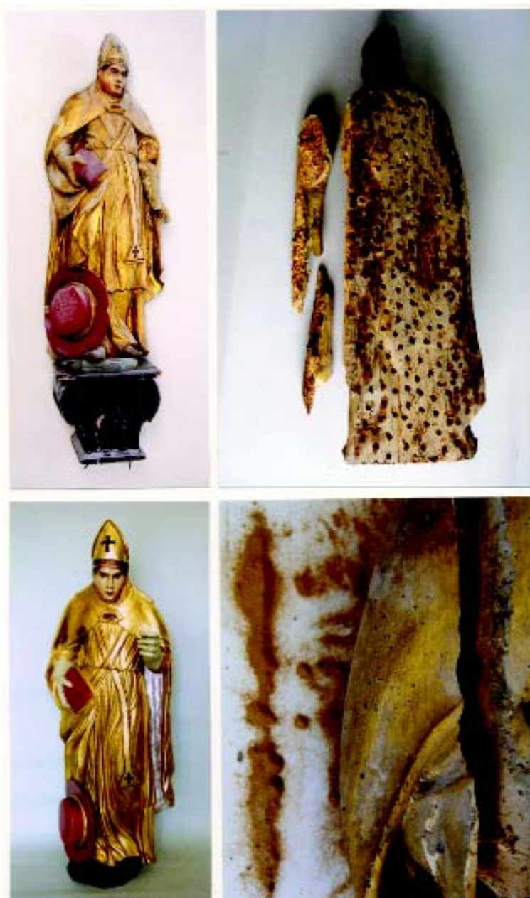
Oltar Sv. Antuna Padovanskog, (17.st.), RKT župa Kraljice Sv. Krunice, Remetinec Obnova asistentskih skulptura: Sv. Jeronim prije i nakon provedenih konzervatorsko- restauratorskih radova (fot: 1. i 3.); stanje skulpture (fot:2. i 4.)