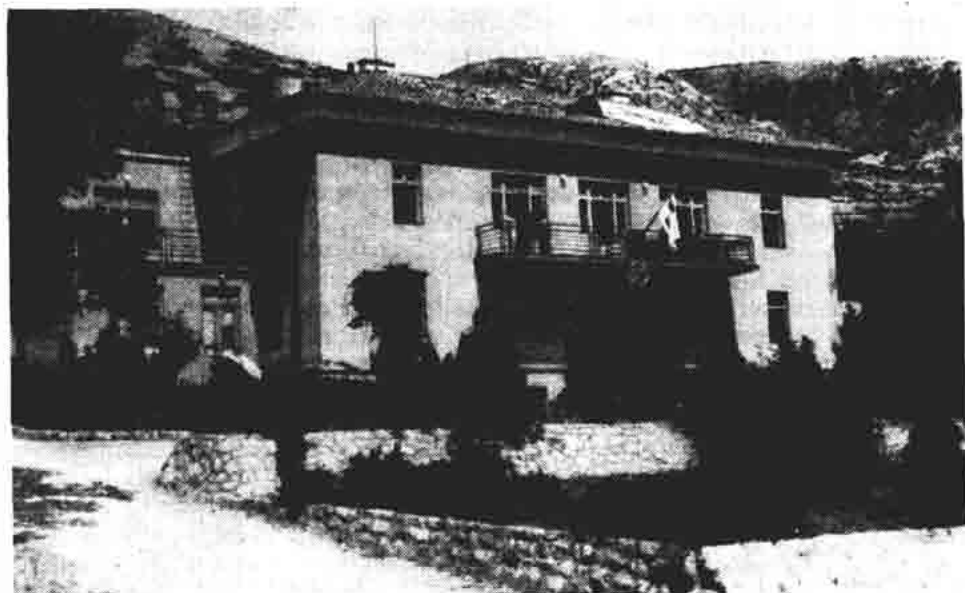
Sl. 72. — Senjska bolnica s lijepo uređenim vrtom, podignuta 1932 (stanje 1942).

kovniju 82 . God. 1843. sagrađena je u Otočcu nova jednokatna i solidna vojna bolnica 83 .