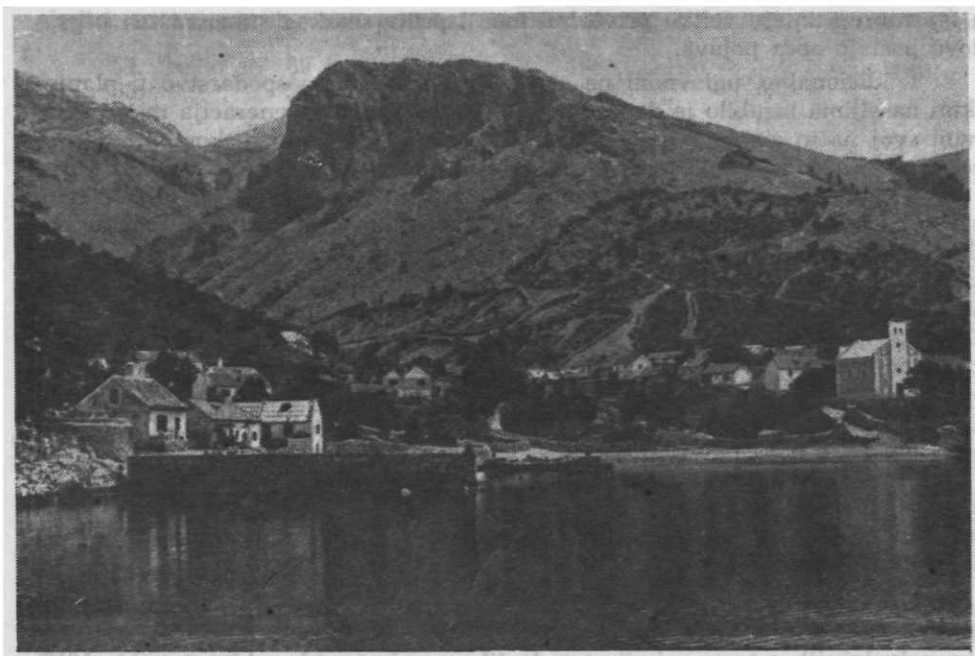
Sl. 10. — Senjsko Lukovo s uvalom i Piškulja vrhom

Treći sloj stanovnika pripada onima koji su u sjedišta kompanija dolazili po potrebi službe, zadržavali se ovdje duže ili kraće vrijeme i zatim odlazili. To su bili oficiri, podoficiri, agenti i manipulanti u vojnom skladištu drva, financijski službenici koji su ubirali razne pristojbe od uvezene robe, jer su Sv. Juraj i Jablanac bili vojničke luke na graničnom sektoru i sva roba koja se uvozila potpadala je pod carinu, zatim učitelji, župnici, kapelani, trgovci drvom kad je Vojna krajina prestala eksploatirati velebitske šume u vlastitoj režiji, općinski, državni i privatni službenici poslije razvojačenja Vojne krajine. Neki su od njih osnovali ovdje svoje obitelji i trajno se nastanili. Spominjemo samo neke od doseljenika koji su ovamo došli u drugoj polovici 18. i prvoj polovici 19. st. To su bili obitelji Pajdaš (prvi put se javljaju u matricama 11. februara 1759; baptisatus fecit Matthäus, filius Simonis et Luciae jugalium Pajdaš levantibus Simone Kirin et Mathia Segnanin), Vidmar (: 18. IV 1849 krstih Juru, sina arendatora Mate Vidmara, vernika plovanije kosinjske),