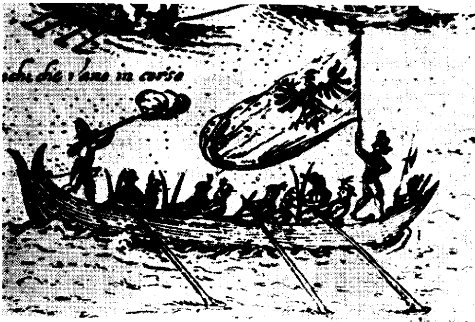
Sl. 12. G. Keller: Uskočka hitroplovka u pomorskom okršaju sa Mlečanima ispred Senja 1617.

Briga o učvršćenju grada, njegovih zidina i kula, koji je u strateškom položaju zauzima izvanredno mjesto ne samo u obrani austrijskih zemalja već i Apeninskog poluotoka, prerastala je mogućnosti Senja. Od tada imamo više podataka o novčanoj i drugoj pomoći rimskih papa, između kojih je Lav X (1513—21) dao sagraditi jednu kulu koja se prozvala papinska i u njoj o