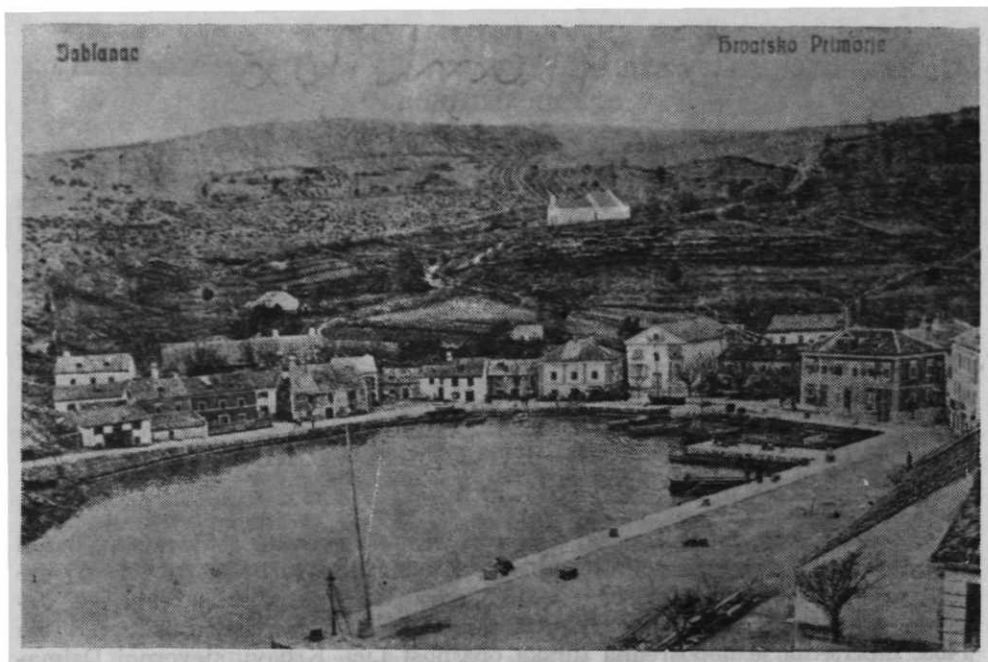
Sl. 11. — Jablanac početkom 20. st.

proces stvaranja Vojne krajine kao zasebne vojne i političke organizacije u Hrvatskoj. 2 Od osnivanja senjske kapetanije morali su Frankopani braniti svoje preostale posjede ne samo od presizanja kralja već i senjskih kapetana. Građani Senja, tog značajnog i izrazito trgovačkog grada, došli su u sukob već s prvim kapetanom Blažom Podmanickim, koji im je nametnuo godišnji danak od 400 zlatnih forinti. Nezadovoljni građani obratili su se vladaru, te ih je on, u namjeri da ih što tješnje veže uz svoje kapetane protiv Frankopana, oslobodio 1471. nametnutog danka i potvrdio njihov statut. 3