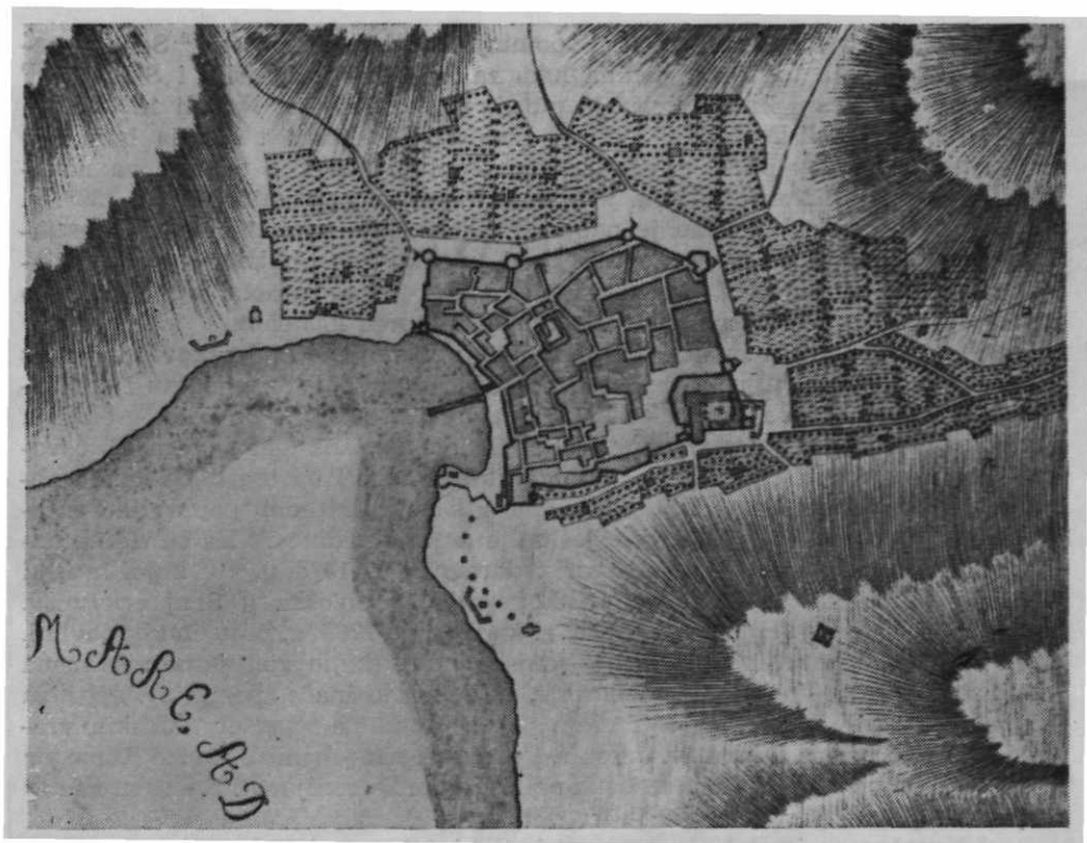
Sl. 15. — Plan Senja iz 1749.

jeme izgradnje nastao »place d'armes«, vojno zborište — kasnije nazvani trg Cilnica — bar u svojim glavnim dimenzijama i strukturi trga, zatvorenog prostora, kao drugi najvažniji senjski trg koji su kasnija stoljeća definitivno oblikovala.