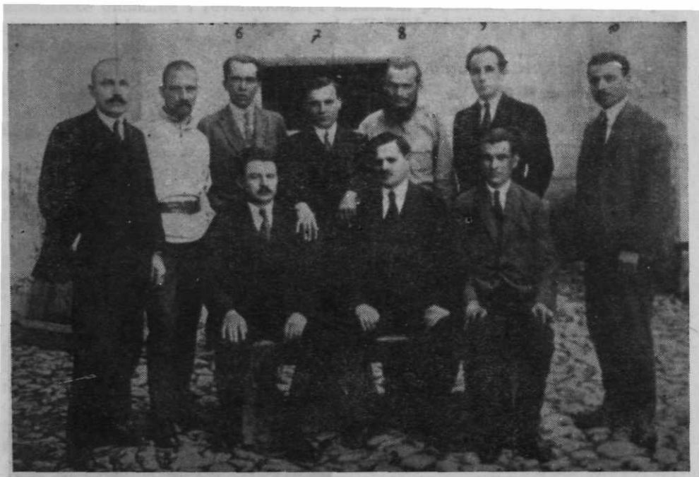
Sl. 30. — VI. Čopić na robiji u Požarevcu (1922—1923) sa članovima Izvršnog vijeća KPJ i narodnim poslanicima KPJ. Drugi lijevo stoji u bijeloj košulji.

Za prvomajsku proslavu 1924. u Zagrebu vršene su velike pripreme. Omladina je masovno dijelila letke i ispisivala parole po zidovima i asfaltu s pozivom na obustavu rada i za dolazak na skupštinu. Na zboru pred kinom »Balkan« sakupilo se 7.000 radnika. Dozvola policije glasila je za skupštinu u zatvorenoj prostoriji. Čopić kao glavni govornik snašao se na taj način, što je stavio govornicu i predsjednički stol na izlazna vrata kina, tako da su govornici bili