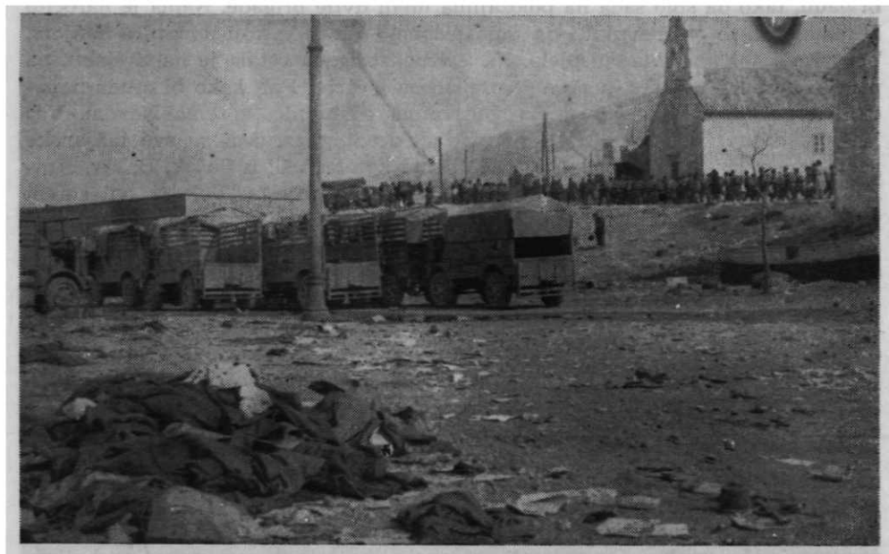
Sl. 36. — Poraženi i prisiljeni na kapitulaciju talijanski vojnici ostavljaju svu ratnu spremu i posramljeni se vraćaju kući. Na cesti ispred sv. Ambroza u Senju IX m. 1943.