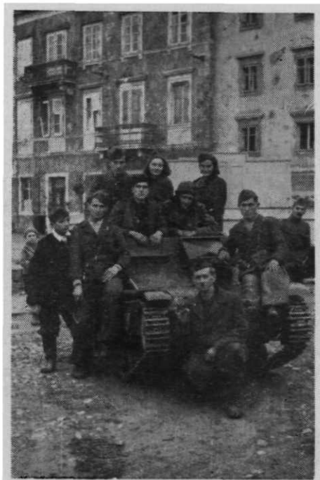
Sl. 37. — Pripadnici jedne partizanske jedinice na osvojenom talijanskom tenku — u Senju 14. 9. 1943.

Razoružanu diviziju pustili smo čitavu pješice da se vrati odakle je pobjedonosno došla 1941, bez poziva na odgovornost za počinjene zločine u našoj zemlji. Na osnovu nekih hitlerovskih dokumenata vidi se dobro, kako je Murgie imala stalnu vezu s Nijemcima i kako su oni pokušavali da joj priskoče u pomoć. Tu se spominje i Hitler, koji se ponosio s divizijom Murgie što mu je jedina ostala vjerna. Stoji i to, da mu dugo vremena nisu smjeli priznati vijest