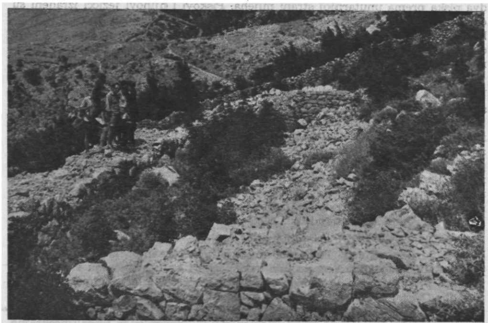
Sl. 58. — Ostaci stare tzv. »grčke kuće« iznad zaselka Pijavica.

Ljubav prema rodnom kraju i domovini neobično je razvijena kod Podgoraca, pa se često i sada dešava da se Podgorci koji su ranije odselili u strani svijet vraćaju starom domu gdje nalaze mir i zadovoljstvo. Oni pak koji su se nedavno odselili u veće gradove diljem zemlje sve više barem za ljetnih dana svraćaju i posjećuju stara ognjišta gdje se osjećaju srećnima i gdje najradosnije provode svoj odmor. Zadnjih godina sve je više mladih Podgoraca koji popravljaju svoje napuštene domove, uređuju mjesta, grade ceste i unapređuju svoj kraj u koji oni sami i ostali posjetioci senjskog kraja zalaze i nalaze odmor i rasonodu. Lijepi primjer u tome su postigli Starigradani, Lukovčani, Kladani, Prižnani, Jablančani i Jurjevčani.