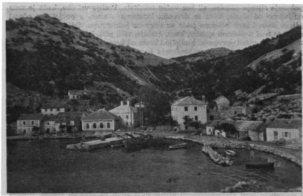
Sl. 56. — Donji Starigrad prije rata.