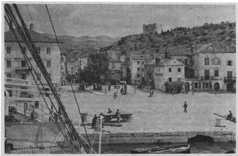
Sl. 61. — Senjska obala sa Potokom (oko 1936).

Od 1809. do 1813. Senj je središte distrikta Napoleonove kraljevine Ilirije. Premda je vladavina Francuza bila kratkog vijeka, ona je u Senju i drugdje ostavila vidljivih i korisnih rezultata na kulturnom i privrednom području.