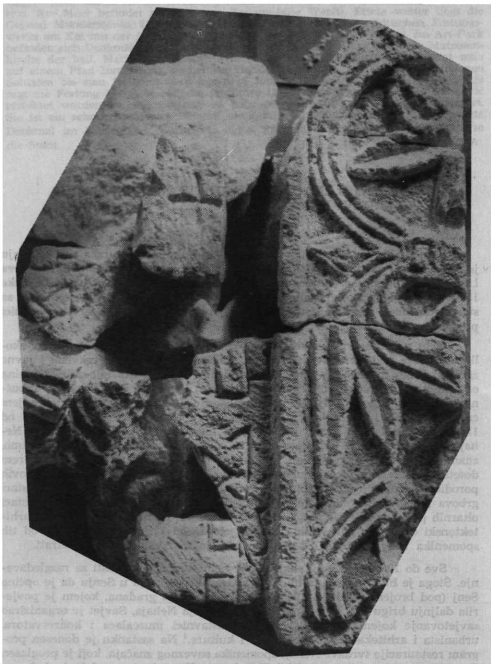
Sl. 112. — Senjska ploča (11-12. st.), sačuvani gornji dijelovi bilnog ornamenta i glagoljskog teksta