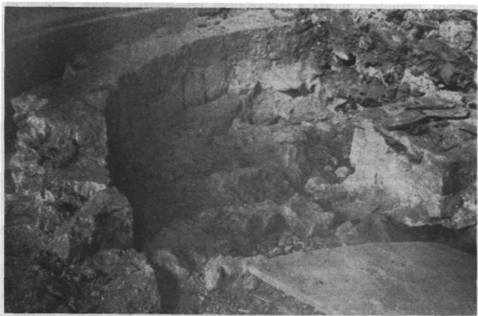
Sl. 115. — Unutrašnji dio crkve sv. Jurja(?), apsida i oltar, otkopano u tvrđavi Nehaj 1964.

Sigurno je što navodi B. Fučić za Baščansku ploču da je »spomenik završne faze jednog stila i rastakanja ustaljene stilske discipline«, a to isto vrijedi i za Senjsku ploču. Prema iznesenom, Senjska ploča datira iz kraja 11. i prve polovine 12. st., te spada u zadnji stadij pleterne plastike, tj. ranoromaničku epohu. U svakom slučaju ovdje se radi o starom spomeniku, jednom komadu crkvenog namještaja, mlađem od Baščanske ploče, koji izvan sumnje ulazi u registar rijetkih i najstarijih spomenika hrvatske glagoljske pismenosti koja je ovim nalazom prvi puta registrirana na kopnenom dijelu stare Krajine, tj. današnjeg Hrvatskog primorja. To je fragmentaran, vrijedan spomenik i prvo-razredni dokument našeg starog klesarskog umijeća i književnosti koja je započela poč. 10. st. i cvala u vrijeme hrvatskih narodnih vladara u krčkoj biskupiji, pod koju je u crkvenom pogledu spadao grad Senj sa okolicom.