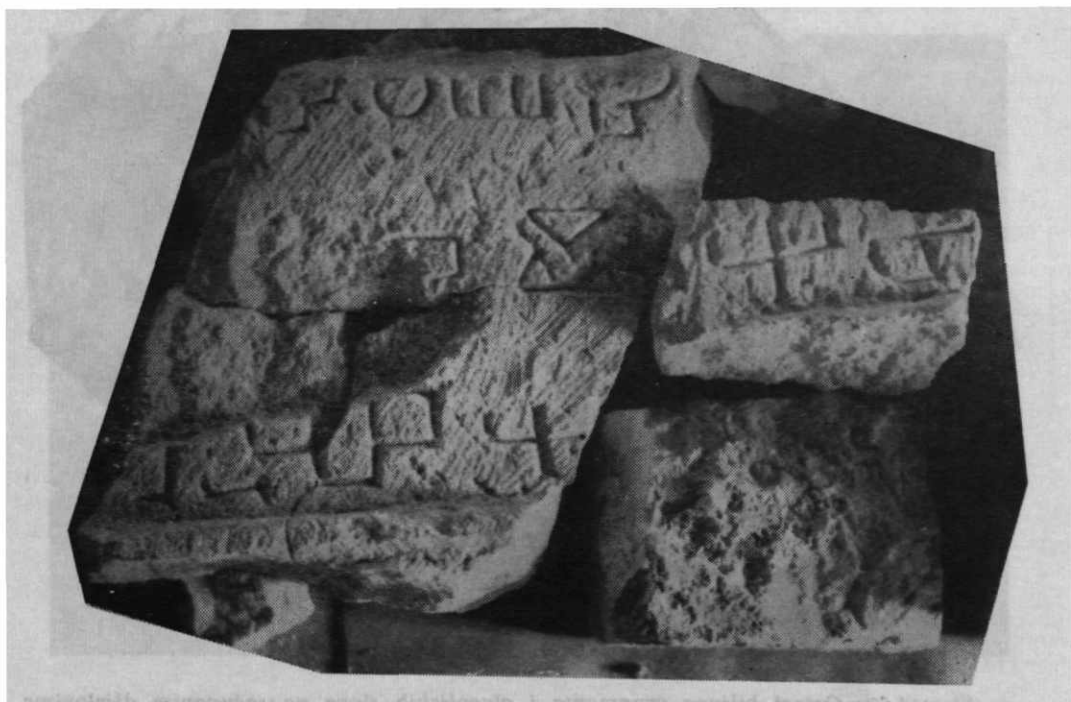
Sl. 113. — Nekoliko dijelova Senjske ploče sa oštećenim sadržajem.

Na osnovu savjetovanja, zatražena je od senjske općine, republičkog i saveznog Fonda za unapređenje kulturnih djelatnosti odgovarajuća financijska pomoć. Za početak radova u 1964. Muzeju je bilo osigurano 10 milijuna dinara. Tako se na osnovu sakupljene dokumentacije započelo velikim istraživačkim i konzervatorskim radovima u Nehaju. Tom prilikom su se kod uklanjanja stepenica (rampe) pred tvrđavom, pod samim ulazom, na dubini od 0,50 do 1,20 m u nabacanom recentnom materijalu iz kraja 18. st. dobivenog kod proširenja starog ulaza, pronašli veći i manji kameni fragmenti, na kojima su bili uklesani biljni ornament i lozice, cvjetovi sa troprutastim brazdama (pleterom) i glagojskim slovima. Shvaćajući važnost nalaza, detaljno je (do živca kamena) pretražen materijal u kojem se naknadno pronašlo oko deset komadića, od kojih se uspjele sastaviti tri veća, koji zajedno s ostalima, makar otežano, omogućuju daljnja istraživanja »Senjske ploče«. 4