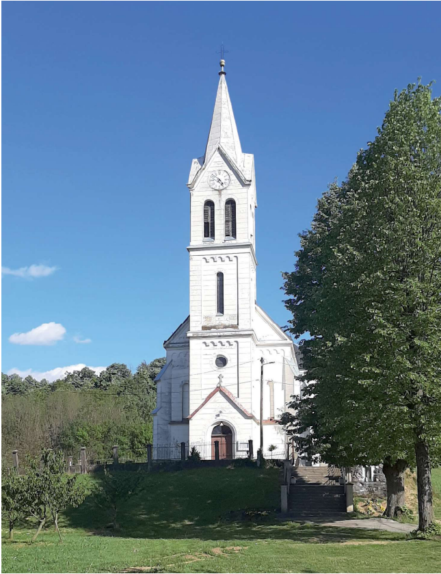
Sl. 2. Pročelje župne crkve u Kozarevcu