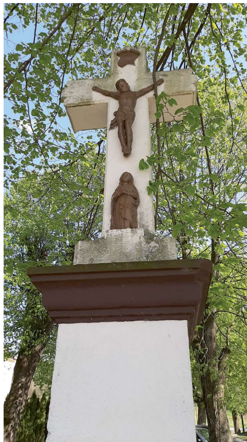
Sl. 5. Raspelo ispred župne crkve u Kozarevcu