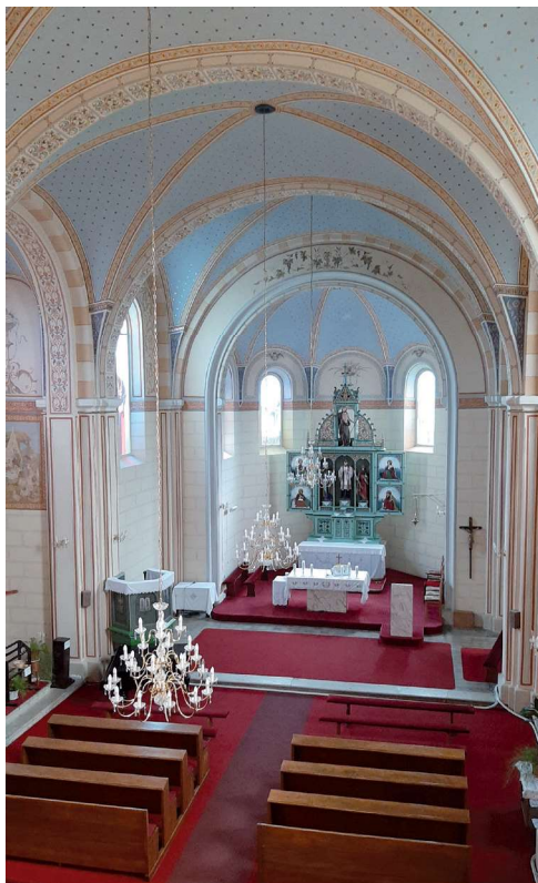
Sl. 4. Unutrašnjost župne crkve u Kozarevcu

godine u mjestu koje u izvorima zabilježeno pod nazivom Podčernja u župi Podvilz u Spiškoj biskupiji koja se prostirala sjevernom Slovačkom. Tada je to mjesto bilo dio jedne županije u sjevernom dijelu Ugarskog Kraljevstva, a danas se mjesto Podwilk nalazi u Poljskoj (oko 85 km južno od Krakowa). Ne znamo kada je došao u ove krajeve i gdje je službovao otkad je zaređen za svećenika 1804. godine do dolaska u Kozarevac. Ovdje je vodio novosnovanu župu punih 11 godina, odnosno do smrti 5. ožujka 1831. godine. Očito je bio bolestan jer je zadnji put sprovode u Kozarevcu vodio u prosincu 1830. godine. Od početka 1831. godine sakramente je dijelio kapelan iz Pitomače Ivan Lovković, a od veljače fratar Julijan Glavak koji je došao iz Koprivnice kao ispomoć bolesnom župniku. Već dva tjedna nakon smrti župnika Hovanca u Kozarevec je stigao upra-