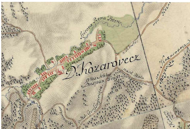
Sl. 1. Kozarevac na topografskoj karti iz druge polovine 18. st.

također tradicionalno uzgajaju koze. 2 Počeci naseljavanja Kozarevca i porijeklo prvih stanovnika svakako je tema za daljnja istraživanja. U prvoj polovini 18. stoljeća u Kozarevcu je već bilo mnogo stanovnika. Godine 1733. popisana su 43 domaćinstva koja su župniku u Kloštru Podravskom davala određena dobra kao porez. O veličini naselja svjedoči i činjenica da je 1745. godine u Kozarevcu sagrađena crkva koja je bila opremljena s čak tri oltara, zvonima i svim potrepnostima za slavljenje svete mise. To je bila drvena crkva koja je mnogo puta popravljana, a oko nje se nalazilo i groblje. Crkva je bila posvećena sv. Franji Ksaverskom čija se slika nalazila na glavom oltaru uz skulpture svetih mučenica Barbare i Katarine Aleksandrijske. Na gornjem dijelu toga oltara još je bila slika svetog biskupa Donata i skulpture svetih redovnica Klare i Katarinske Sijenske. Na dva pokrajnja oltara bile su slike sv. Roka, odnosno sv. Ivana Krstitelja. 3 Prema ovim