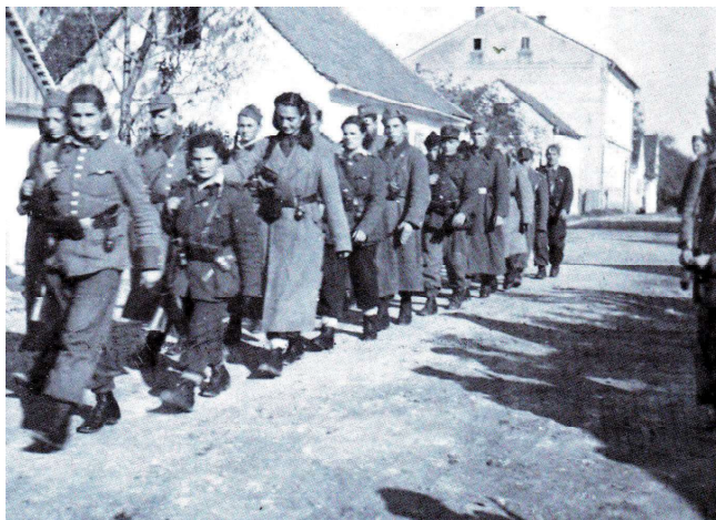
Sl. 4. Prolazak partizana kroz Martijanec, monografija 17. udarne slavonske brigade