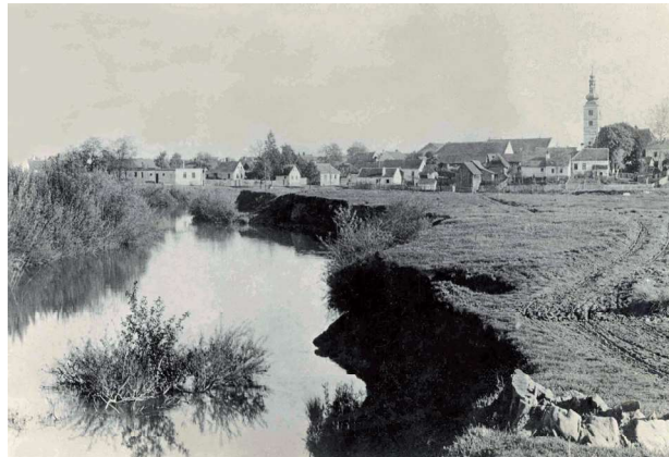
Sl. 1. Razglednica Ludbrega iz 1940-ih.

U travnju su se počele predosjećati završne borbe, nakon proboja Srijemskog fronta (12. 4.) 3. jugoslavenska armija pod vodstvom Koste Nađa započela je s oslobođenjem slavonskih i podravskih naselja. 14 Ovaj kraj nadlijetali su avioni obaju zaraćenih strana. Pokoja bomba pala bi na polje ili čak u blizini sela. Četrnaestog ožujka jedan je avion pao u Dubovici, na staju Toplakova posjeda. U eksploziji aviona i od urušavanju poginula je jedna osoba koja je tek dva mjeseca kasnije pokopana u Velikom Bukovcu. 15 Pokušaj formiranja tzv. Zvonimirove linije nije uspio. Riječ je o zamišljenoj posljednjoj liniji obrane NDH pred partizanskim vojskama koja je trebala očuvati sjeverozapadnu Hrvatsku unutar NDH i zaustaviti Jugoslavensku armiju u prodoru na zapad. Linija je prolazila od Drave, preko Botova i Koprivnice prema Križevcima, Dugom Selu i Karlovcu. Tu se trebala koncentrirati glavnina vojnih snaga NDH sa svom potrebnom ratnom tehnikom, bunkerima, teškim naoružanjem, garnizonima. Bunkereri su se kopali noću i u tome su prisilno sudjelovali svi muškarci