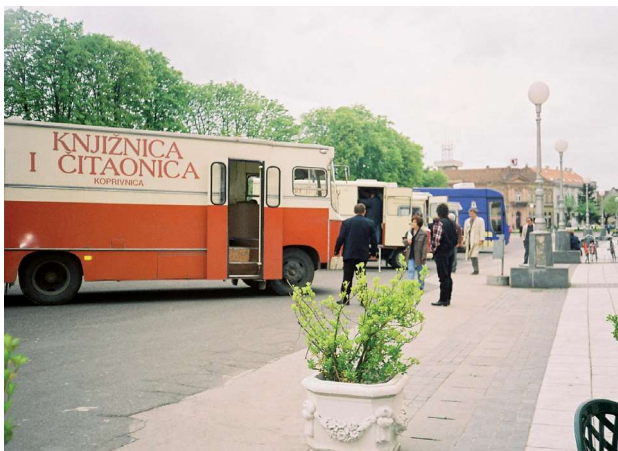
Sl. 1. Prvi festival putujućih knjižnica u Hrvatskoj, održan 1999. godine u Koprivnici