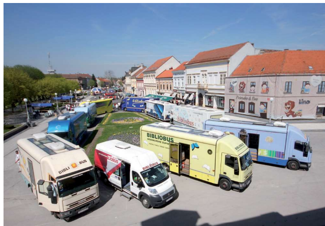
Sl. 2. Festival hrvatskih bibliobusa, Koprivnica, 2013.

uslugama«. Najvažnija značajka pokretnih knjižnica pri tome svakako je njihova pokretljivost i mogućnost da istim fondom i brojem osoblja mogu uslužiti i nekoliko međusobno udaljenih područja u istom danu, uz ostvarivanje rezultata koji zadovoljavaju knjižnične norme kako kvaliteto- tom, tako i kvantitetom usluga.