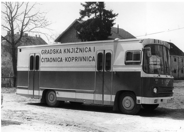
Sl. 3. Prvi koprivnički bibliobus, 1979.