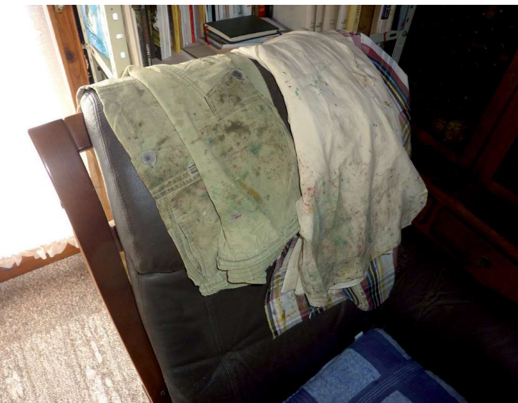
Sl. 4. Preko naslona stolca slikareva radna odjeća

radi gotovo iz dana u dan, praktički veći dio svojega života. A taj je posao, nekolicini je poznato, gotovo pa postala slikareva opsesija. U tom našem malom Prekodravlju, od jedva kakvih stotinjak kvadratnih kilometara, prikupiti nekoliko desetaka tisuća artefakata jezičnog blaga, pa to je posao za – titana! Želim ga samo postaviti u kakve-takve korelacije! Govori se, naime, da s poznavanjem četiri tisuće engleskih riječi, možete odlično funkcionirati na engleskom govornom području. Stručnjaci za