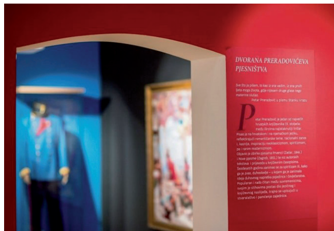
Sl. 2. Dvorana poezije – detalj (snimio: K. Toplak, Virovitičko-podravska županija)

su i oni obnovljeni te pripremljeni za korištenje. Uređen je i dio okoliša: parkiralište, pristupne staze, ograda, a nabavljeni su i projektori te jedan veliki ekran osjetljiv na dodir. Realizaciji projekta sufinanciranjem multimedije pridružili su se Ministarstvo turizma i Hrvatska turistička zajednica.