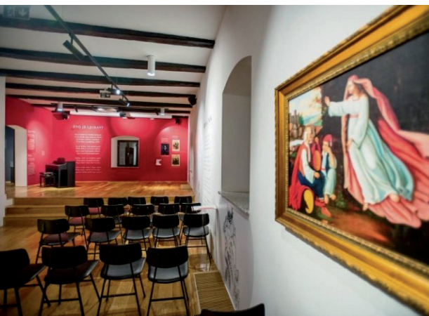
Sl. 1. Dvorana poezije