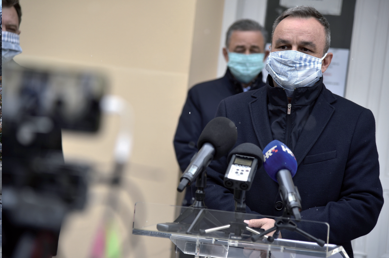
Stožer civilne zaštite Koprivničko-križevačke županije redovito nas je izvještavao o epidemiološkom stanju