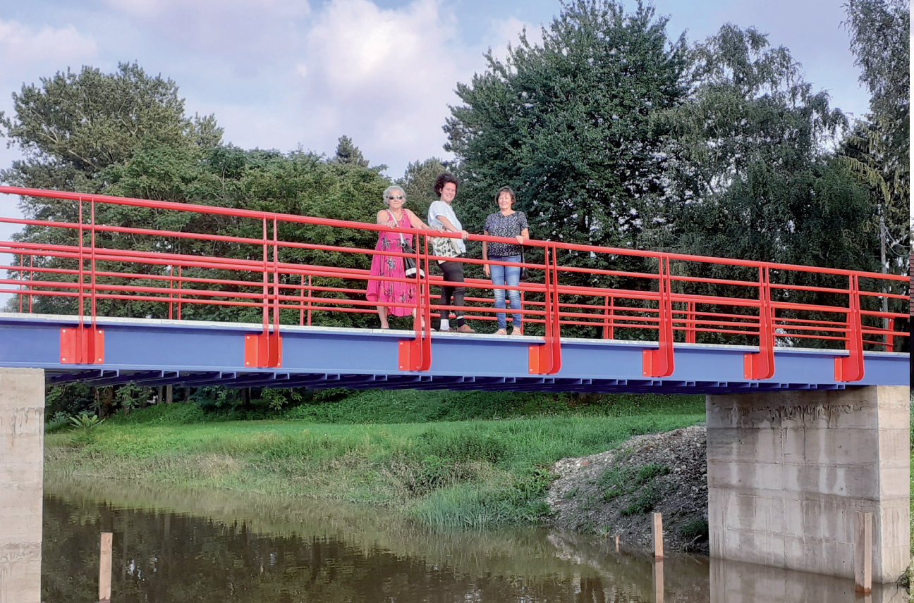
Ludbrežani će lakše na omiljeni Otok mladosti novim mostom preko Bednje