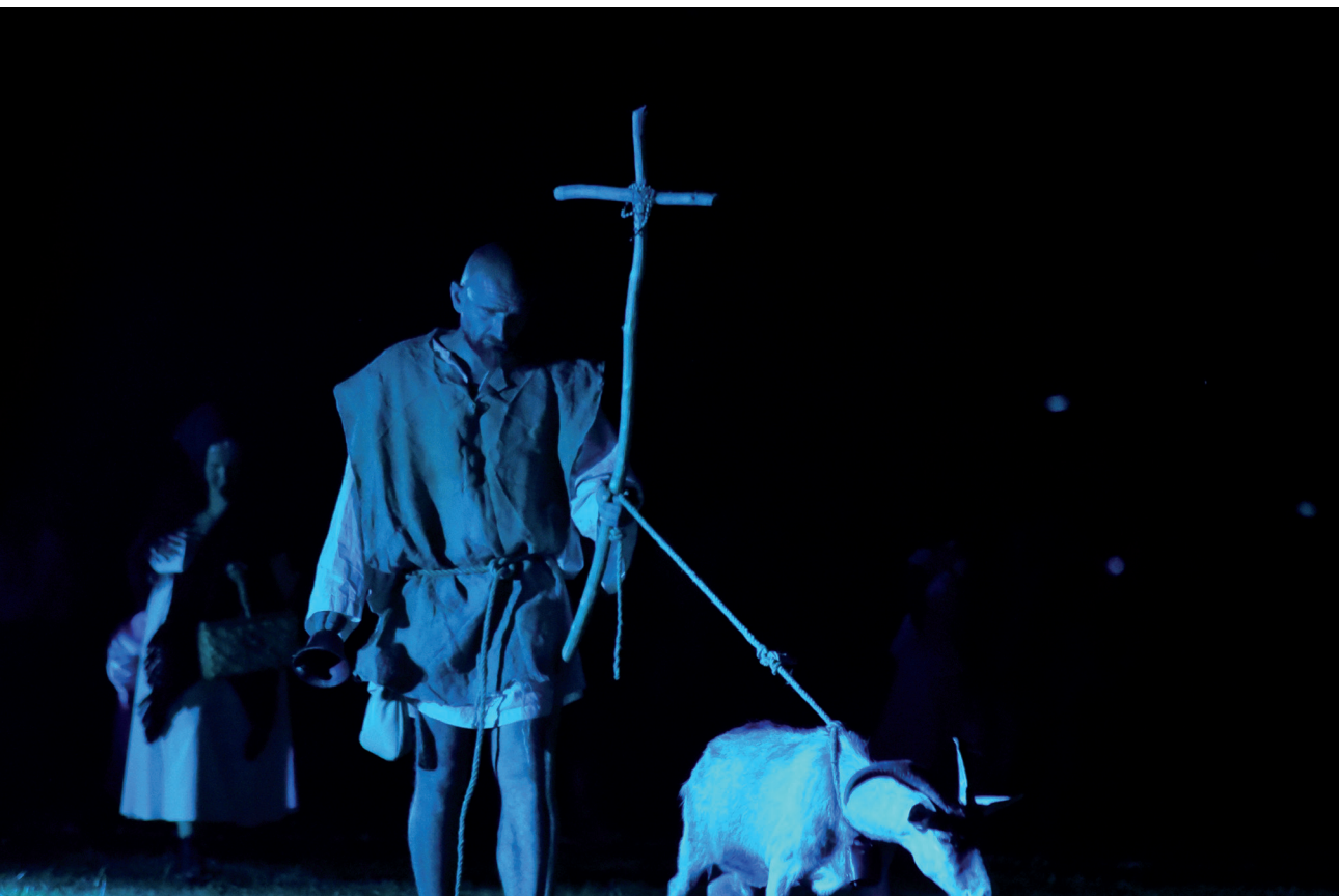
Picokijada se unatoč COVID-19 epidemiji ove godine uspješno održala