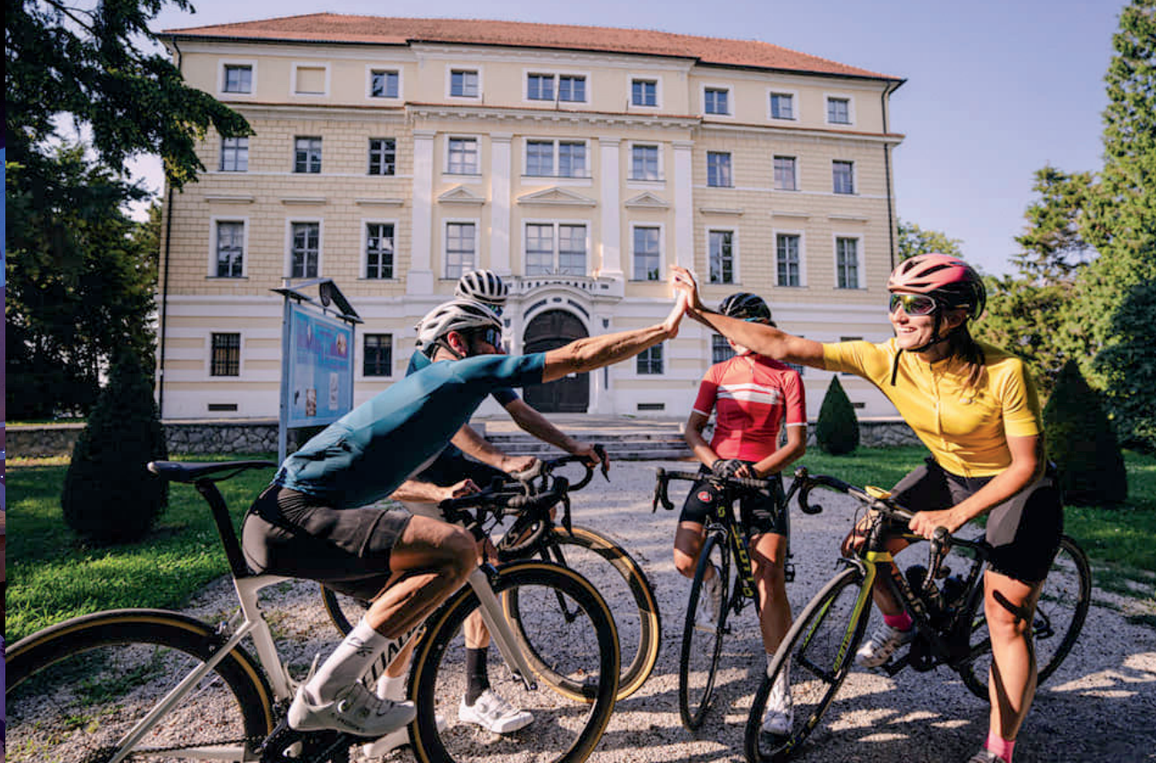
Udruga ŠRD BSV iz Ludbrega ove je godine organiziralo Crazy-Hill biciklijadu u dužini preko 100 km