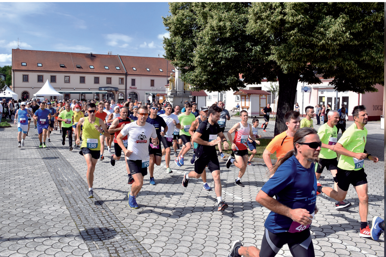
Utrka »Centrum Mundi 2020« održala se u nešto kasnije mterminu no obično (snimio: D. Vađunec)