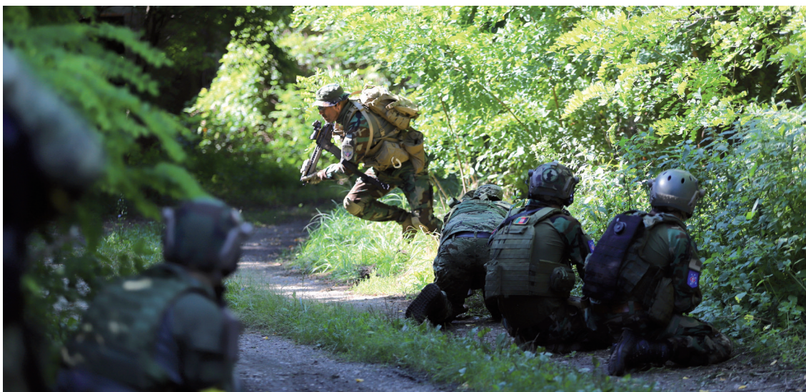
Air soft susret u Koprivničkim bregima