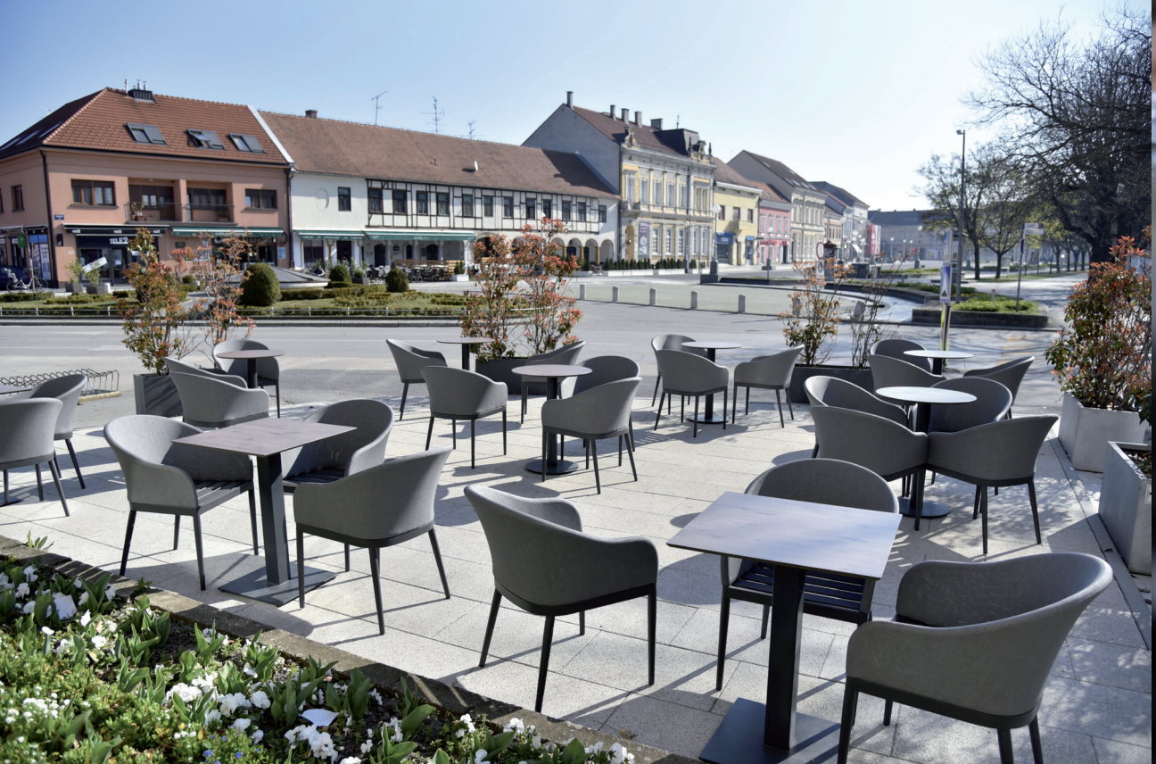
Središte Koprivnice je uslijed izolacije bilo neobično pusto