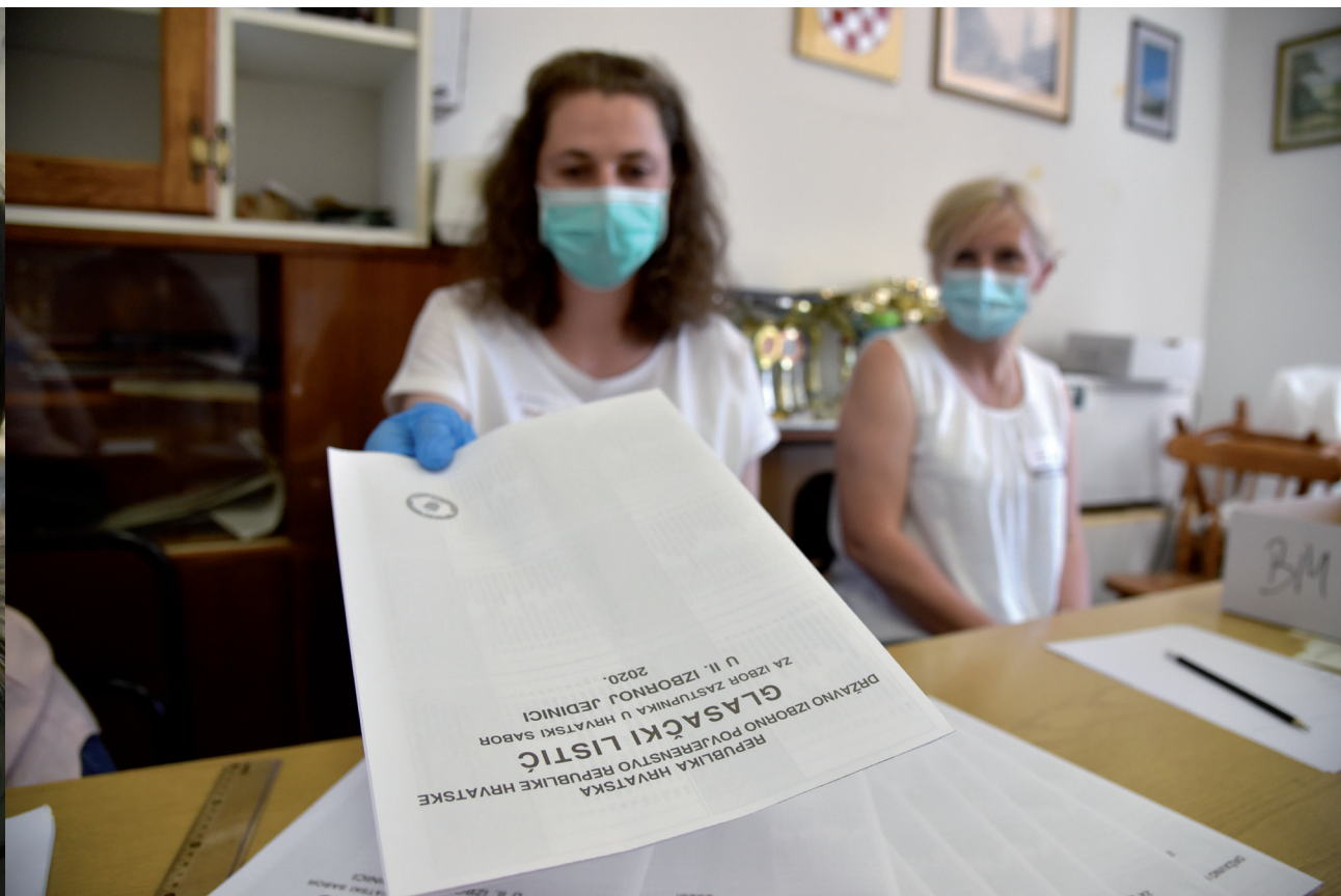
Parlamentarni su izbori održani u posebnim okolnostima