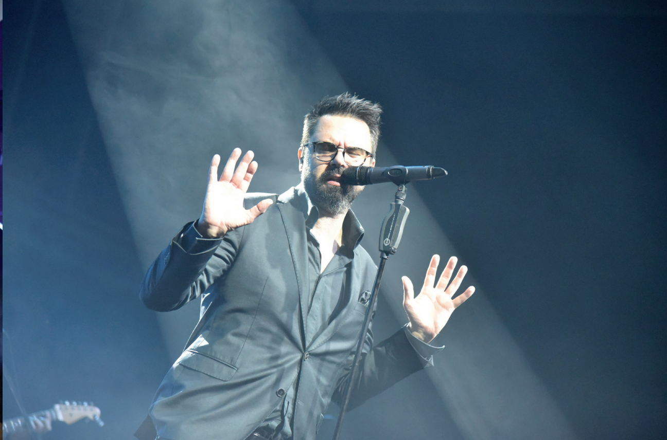
Raspjevani Petar Grašo za rođendan Koprivnici