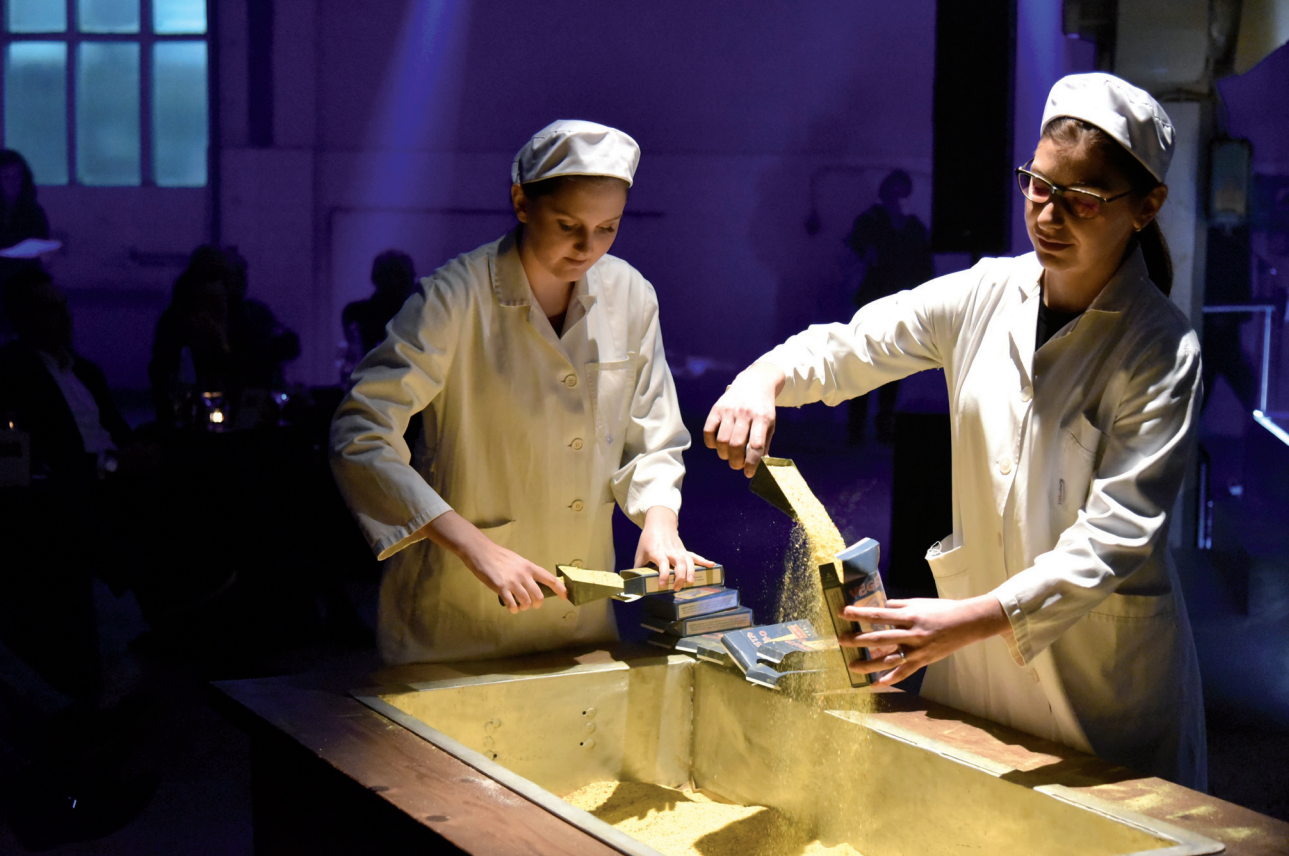
Svečano je bilo u Podravki sredinom prosinca 2019. godine na obilježavanju 60 godina Vegete