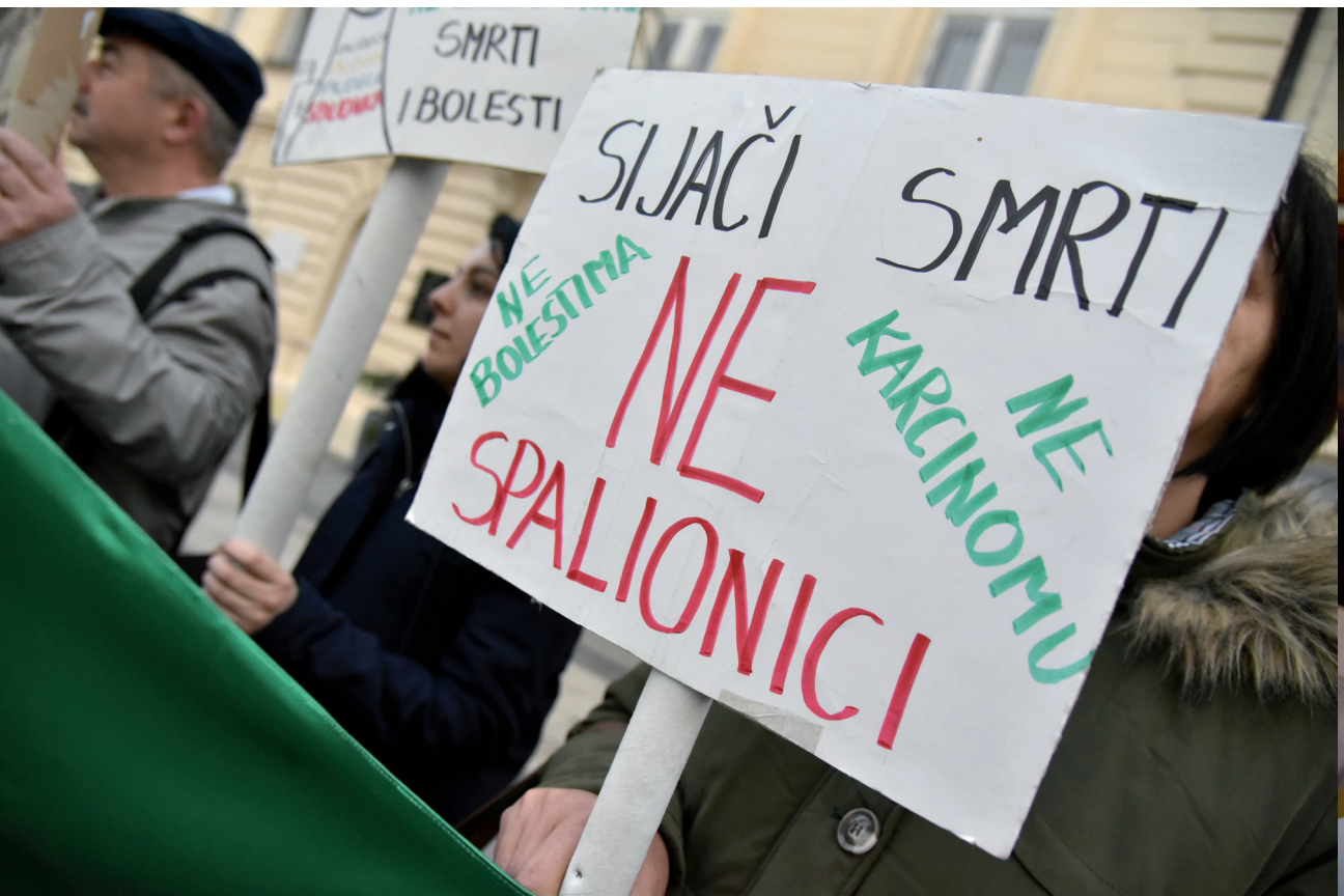
Prosvjed mještana Koprivničkog Ivanca i okolice protiv spalionice otpada na Piškornici