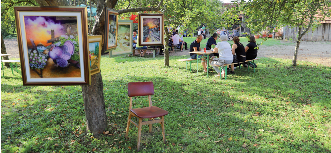
Druga šetnja kroz naivu u Hlebinama održana je u kolovozu 2020. godine