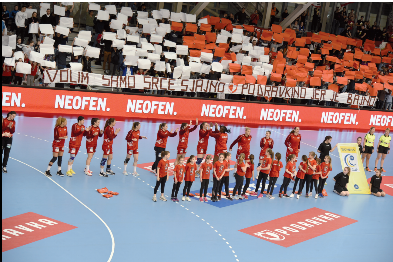
Podravka Vegeta pobijedila je Thüringer i nakon podosta godina izborila polufinale EHF Kupa