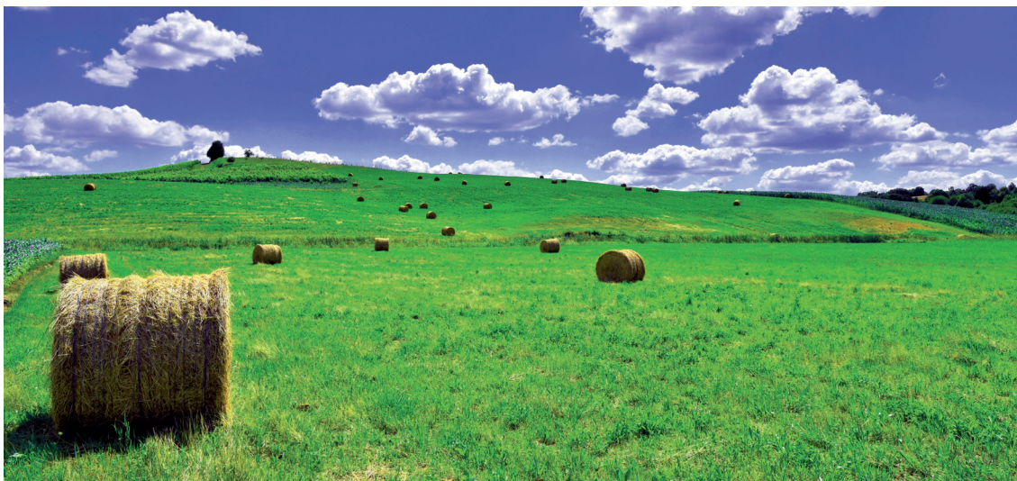
Bajkovita kasnoletnja polja podno virovske Bilogore