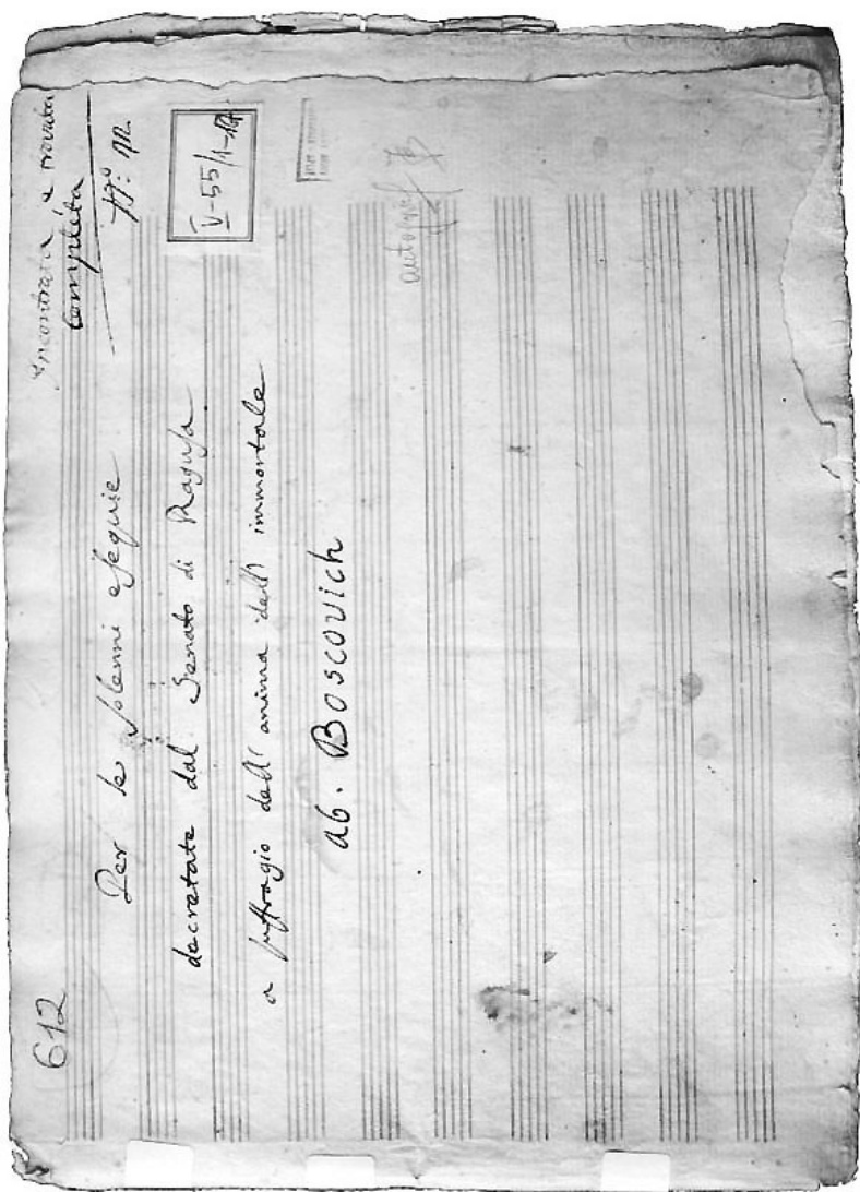
Slika 3. Bajamontijeva posveta Boškoviću na prvoj stranici nepotpune partiture Requiem a (Sk-V/55:1)