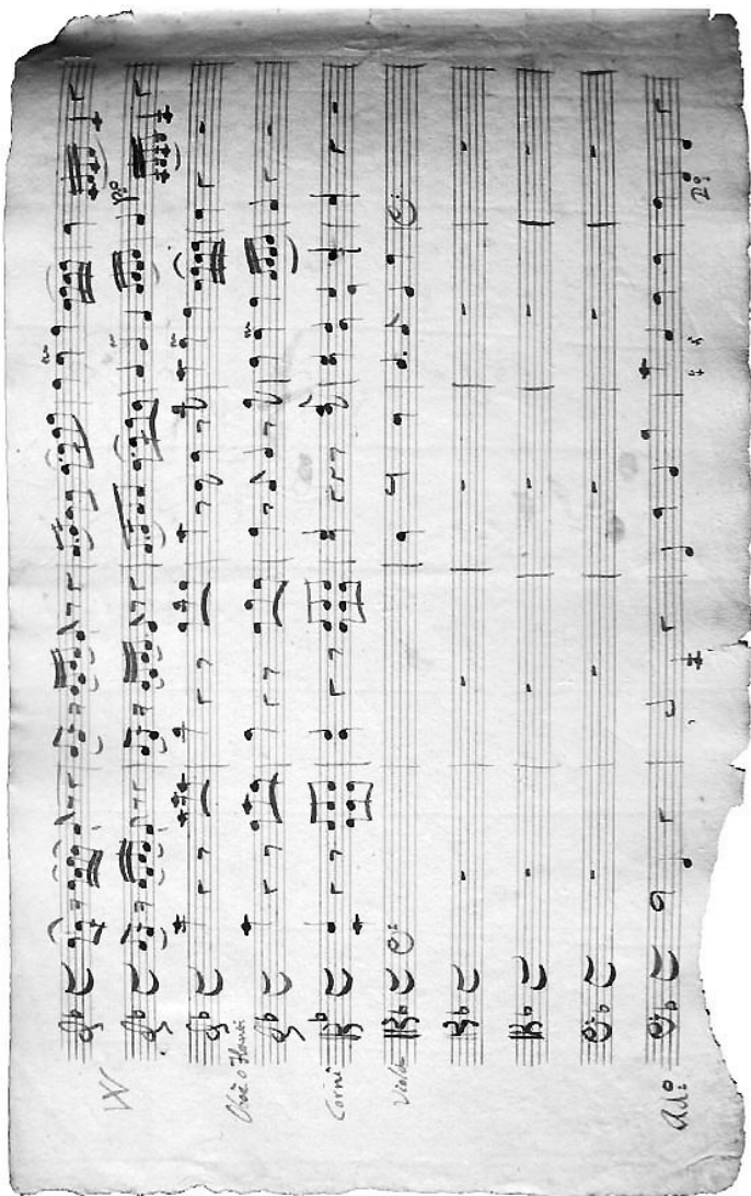
Slika 4. Početak Bajamontijeva Requiem (autograf, druga stranica nepotpune partiture Sk-V/55:1)