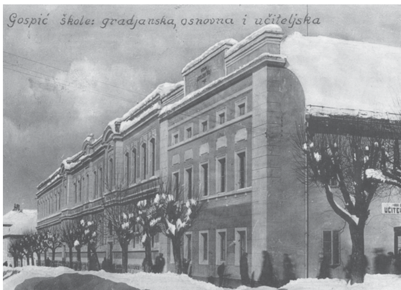
Slika 1. Zgrada gospićkih škola 1934. (HR DAGS 185, 5—49)

Promjenom imena države u Kraljevinu Jugoslaviju utvrdila se podjela Kraljevine na banovine čime je Gospić pripao Savskoj banovini (1929. — 1939.), da bi između 1939. i 1941. bio dio Banovine Hrvatske. Gospić je neovisno o državnim upravnim promjenama u međuratnom razdoblju ipak bio najjače školsko, kulturno-prosvjetno, trgovačko i komunikacijsko središte u Lici, s brojnim