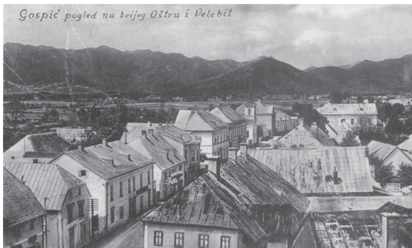
Slika 3. Gospić, Kaniška ulica s pogledom na Velebit, 1934. (HR DAPS 185, 5–70)

uređuju novi putovi koji omogućuju jaču povezanost Gospića s drugim ličkim mjestima.