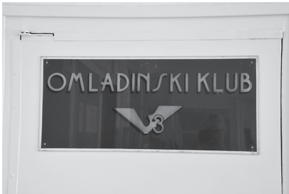
Slika 3. Ploča s nazivom Kluba

U ovom su razdoblju u okviru klupskih aktivnosti obnovljeni pokušaji oživljavanja filmskih projekcija. 138 Ponedjeljkom su održavane filmske tribine u sklopu kojih se svakog drugog tjedna prikazivao film nabavljen iz Filmoteke 16 . Petkom je profunkcionirala glazbena tribina. Pored slušanja glazbe po sistemu jer ste vi to tražili , povremeno su bili održavani i koncerti. U okviru klupske glazbene tribine u petak 22. ožujka 1985., održan je koncert Dixiland band Glazbene škole Varaždin . 139 Obnovljena je i plesna škola koju su, uz naplatu, mogli pohađati i ostali, dok je za učenike Centra bila besplatna. 140