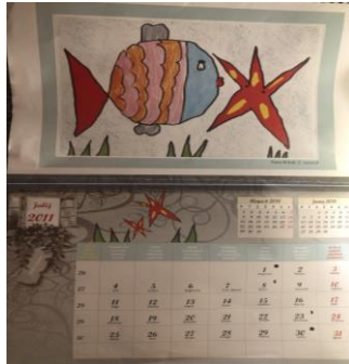
Slika 5: Likovni rad na općinskom kalendaru

Odabrani umjetnički radovi šalju se i lokalnim novinama: List iz Markovcev. Jedan od radova prikazan je na općinskom kalendaru, srpanj 2011.