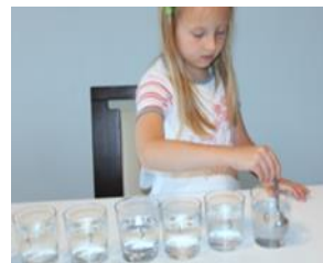
Slike 1, 2, 3: Priprema za natjecanje

U dodatnoj nastavi pripremamo dramatizaciju bajki, koje se krajem školske godine prezentiraju kolegama i roditeljima. Pisanjem vlastitih članaka surađujemo i s lokalnim novinama koje objavljuju naše članke jednom mjesečno.