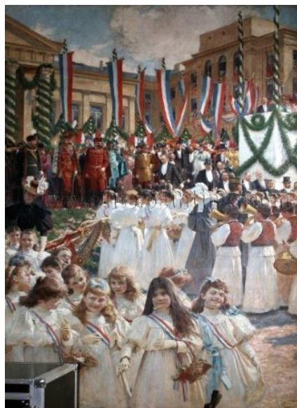
Slika 3. Vlaho Bukovac, Živio kralj 205

Nakon svečanosti otvorenja nove zgrade HNK, okupili su se u zgradi Sveučilišta te se dogovorili za daljnje djelovanje. Po pisanju časopisa Obzor , oko 11 sati, nakon što su stigli ispred Jelačićeva kipa predvođeni Vladimirom Vidrićem koji je nosio studentsku zastavu iz 1848. godine, stotinjak je studenata na Trgu bana Jelačića spalilo mađarsku