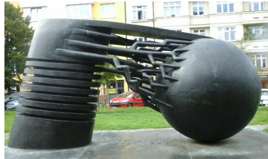
Slika 5. Teslina ulica i spomenik u Pragu (Praha 6, Dejvice)

Treba spomenuti i da je u Pragu studirao Tadija Smičklas (1843. – 1914.), hrvatski povjesničar, i to 1864. godine povijest i zemljopis, dok je Andrija Mohorovičić, hrvatski geofizičar u Pragu završio studij matematike i fizike na Karlovu Sveučilištu u Pragu