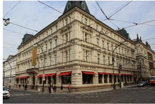
Slika 4. Kavarna Slavija u kojoj su se okupljali hrvatski studenti 235