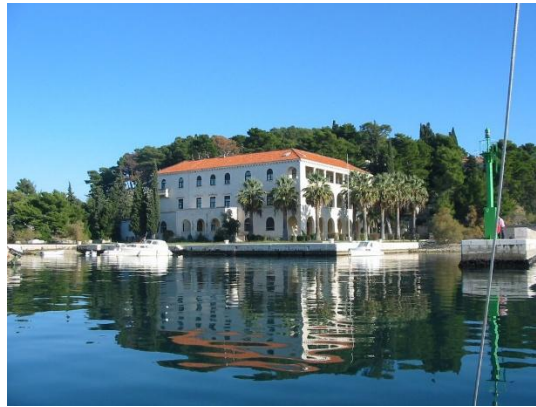
Slika 8. Zgrada Oceanografskog instituta (1939., današnji Institut za oceanografiju i ribarstvo na rtu Marjana) 298

svojim djelovanjem „najlipšem gradu na svitu“ ostavio iznimno duhovno, ali i kulturno naslijeđe.