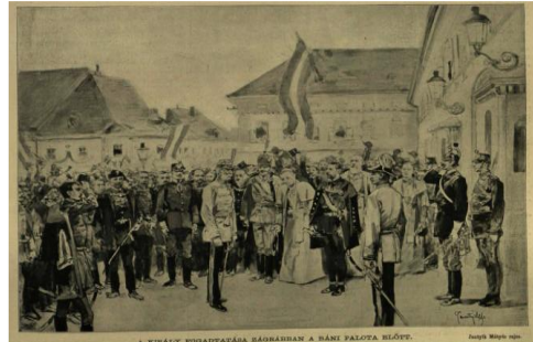
Slika 2. Franjo Josip I. označava kraj radova na zgradi HNK u Zagrebu (lijevo) i svečani doček Franje Josipa I. na otvorenju iste (desno) 204