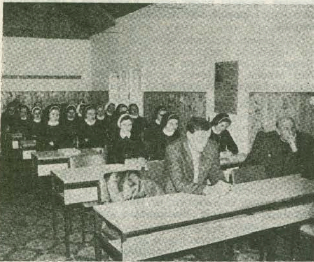
Sudionici pažljivo prate predavanja