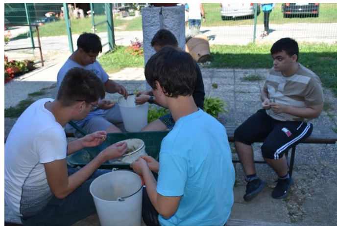
Slika 3: Čišćenje graha

Nakon toga počeli smo sa drugim aktivnostima. Donijeli su nam grah, kojeg su učenici najprije morali odvojiti od stabljike, razvrstati po stupnju suhoće u posude namijenjene tome i na kraju očistiti. Aktivnost smo odradili sa voljom uz obilje smijeha, razgovora i zabave..