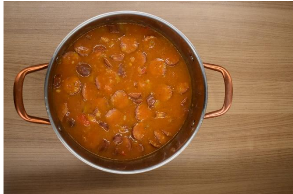
Slika 7: Grah je kuhan

Na kraju radnog dana, učenici su ponosni na svoje kuharske vještine. Razumiju da su slijedili upute, primijenili znanje i napravili ukusan obrok. Cilj je ostvaren. Učenici će i kod kuće sebi i svojim ukućanima moći pripremiti obrok.