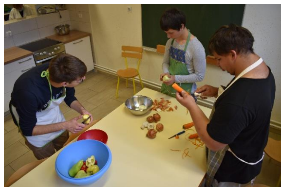
Slika 5: Učenici pripremaju sastojke