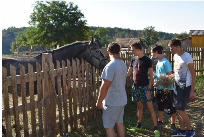
Slika 2: Hranjenje životinja

Naš prvi zadatak je bio hranjenje životinja. Stoga smo najprije otišli do njihovog životnog prostora.