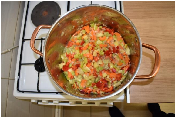
Slika 6: Na početku kuhanja