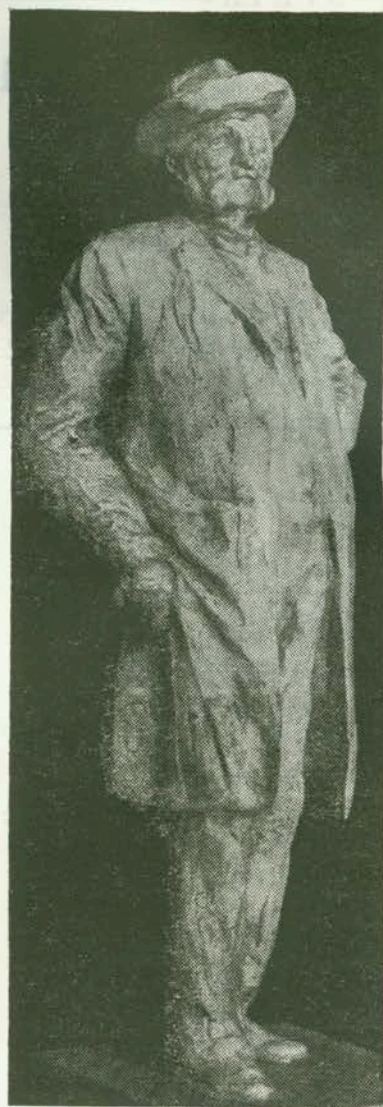
Ivan Zajc (Rad Frangeša — Mihanovića)

vrstiti njegov ugled opernog skladatelja i u svijetu (npr. uz orkestralni sastav kakvog na Rijeci nije imao na raspolaganju), došavši u Beč gdje je tada cvala opereta, stjecajem prilika skladao mnoge operete (23, neke su — njih 7 — ostale nedovršene), tek jednu operu (Bossyjska vještica). U Zagrebu skladao pretežno opere, tek povremeno koju operetu za Beč ili za Zagreb, kad su se iz financijskih razloga ponovno uvele operete (od 1881/2. dalje), odnosno kad u Zagrebu nije bilo stalne opere. —