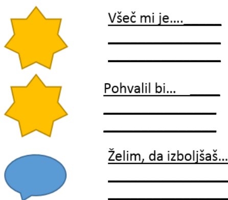
Slika 2: Primer povratne informacije: dvije zvijezde, jedna želja

U vršnjačkoj evaluaciji moramo biti oprezni da učenik koristi konstruktivne povratne informacije kolega iz razreda. Stoga je potrebno naučiti učenike da daju kvalitetne povratne informacije. Ovo bi trebalo biti informativno i ohrabrujuće (primjer: dvije zvjezdice: Dobro sam se snašao, jedna želja: što još moram poboljšati (slika 2).