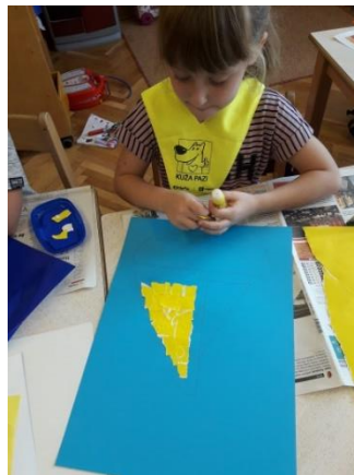
Slika 2: Nastajanje jedrilice

zanima. Tako smo došli do umjetničkog motiva jedrilice. Sad su učenici mogli početi s radom.