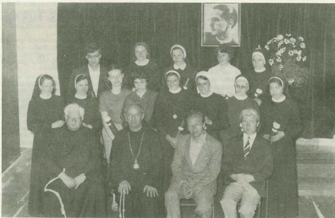
Radosna lica nakon primanja diploma

posobljeni voditi liturgijsko pjevanje po našim crkvama. Od danas Vaše radno mjesto po promisli Providnosti jest crkva, a životno zvanje liturgijska glazba, liturgijsko pjevanje, koje će pratiti i resiti svečanu liturgiju, a ona se odvija u crkvi, na oltaru. Za ovaj uzvišeni posao radili smo s Vama kroz ove četiri godine, i nadam se da smo ispunili želju i izvršili poruku pok. kardinala Šepera što nam je napisao u pismu o programu rada pri otvaranju našeg Instituta: »Želio bih, međutim, istaknuti još jednu važnu činje-