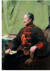
Slika 1. Grof Janko Drašković na slici Vlaha Bukovca 576