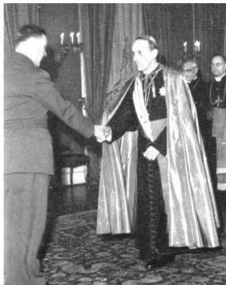
Dictator Pavelic greeting his ally Archbishop Stepinac

Kad je proglašena Nezavisna Država Hrvatska, zagrebački nadbiskup dr. Alojzije Stepinac posjetio je Slavka Kvaternika, 324 a zatim i poglavnika dr. Antu Pavelića po njegovu dolasku u Zagreb. Sam posjet visokog crkvenog predstavnika nositeljima nove vlasti nije još govorio o odnosu Crkve prema njoj. Naime, Crkva je redovito kontaktirala one koji stvarno imaju vlast na određenom području radi svoje pastoralne misije i zaštite vjernika. 325