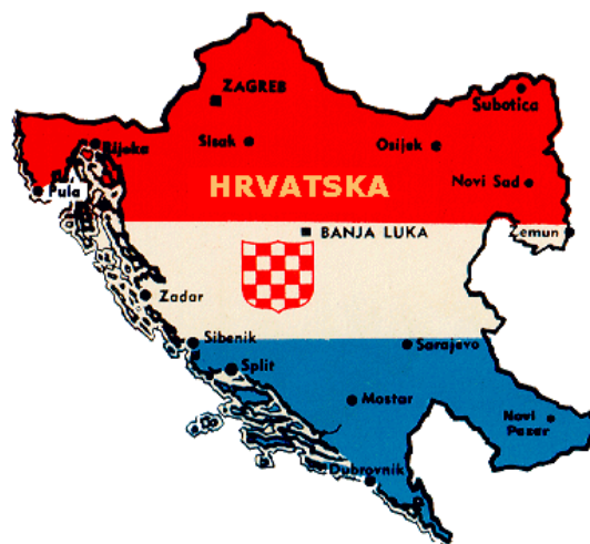
Slika 4. Teritorij Nezavisne Države Hrvatske 329

Spomenuta Stepinčeva poslanica bila je osnovica za utvrđivanje odnosa između Katoličke Crkve i Nezavisne Države Hrvatske. Crkva je imala dovoljno razloga za održavanje dobrih odnosa s državom. Naravno, i ustaške su vlasti nastojale postići što čvršću suradnju s Crkvom, znajući koliki je njezin utjecaj na široke slojeve pučanstva. Lojalnost legitimnih predstavnika Katoličke Crkve bila je dobro prihvaćena od ustaških čelnika, posebno zbog vanjskopolitičkog položaja Nezavisne Države Hrvatske. 328