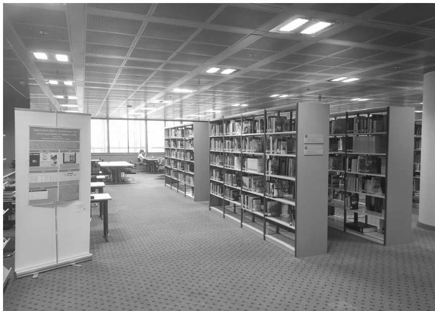
Fotografija 2. Smještaj građe u Zbirci

Navedena građa se nabavlja kupnjom primjeraka publikacija izdanih u Hrvatskoj i inozemstvu u okviru redovnih procesa nabave knjižnične građe Nacionalne i sveučilišne knjižnice te razmjenom građe s drugim knjižnicama i ustanovama koje posjeduju knjižnični fond. Ipak, najveći broj jedinica građe darovan je od državnih institucija Republike Hrvatske, nakladnika, znanstveno-istraživačkih ustanova, udruga i pojedinaca koji su prepoznali važnost ovako organizirane Zbirke i njezin značaj za održavanje sjećanja i znanja o Domovinskomu ratu. Kroz sve procese nabave nove građe, pozornost se posvećuje i nabavi starije građe koja nije pristigla u fond Zbirke u vrijeme svoga izdavanja ili je izdana prije osnutka Zbirke.