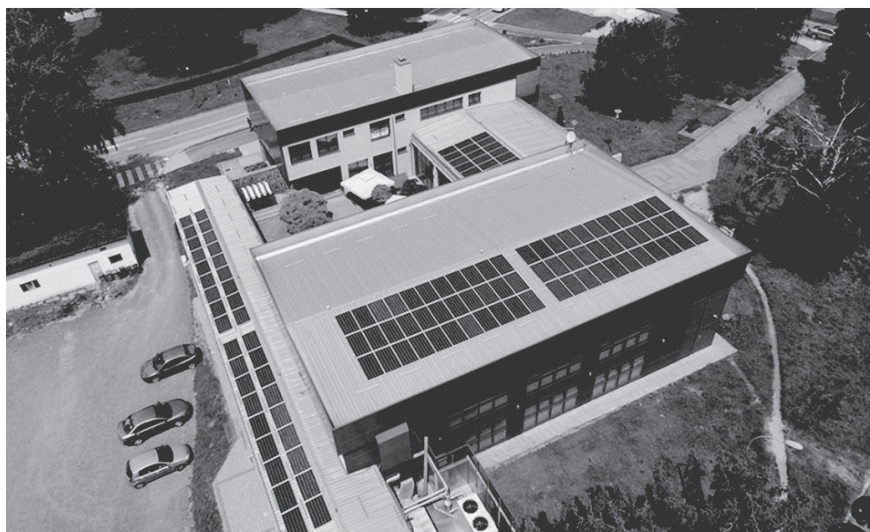
Slika 2. Fotonaponska elektrana u Križevcima izgrađena poslovnim modelom grupnog financiranja građana (Kordić, 2019)

Vlasnik objekta daje mjesto za izgradnju FNE u najam ZEZ-u i obvezuje se da će kupovati električnu energiju od ZEZ-a kao investitora i vlasnika elektrane, ali i kao organizatora poslovnog modela. Nakon perioda otplate investicije, ZEZ besplatno ustupa FNE u trajno vlasništvo najmodavca prostora na kojem je ona izgrađena. Ovisno o lokaciji, vrsti potrošača i mogućim uštedama period otplate investicije iznosi 6-10 godina, a investitori godišnje dobivaju dio glavnice i kamatu na uložena sredstva u visini 2-4% sve do cjelokupne otplate. To je način da građani aktivno sudjeluju u energetskej tranziciji u svojoj lokalnoj zajednici. Po jednakom ili sličnom modelu mogu se organizirati i drugi razvojni projekti koji podižu standard življenja u lokanoj zajednici.