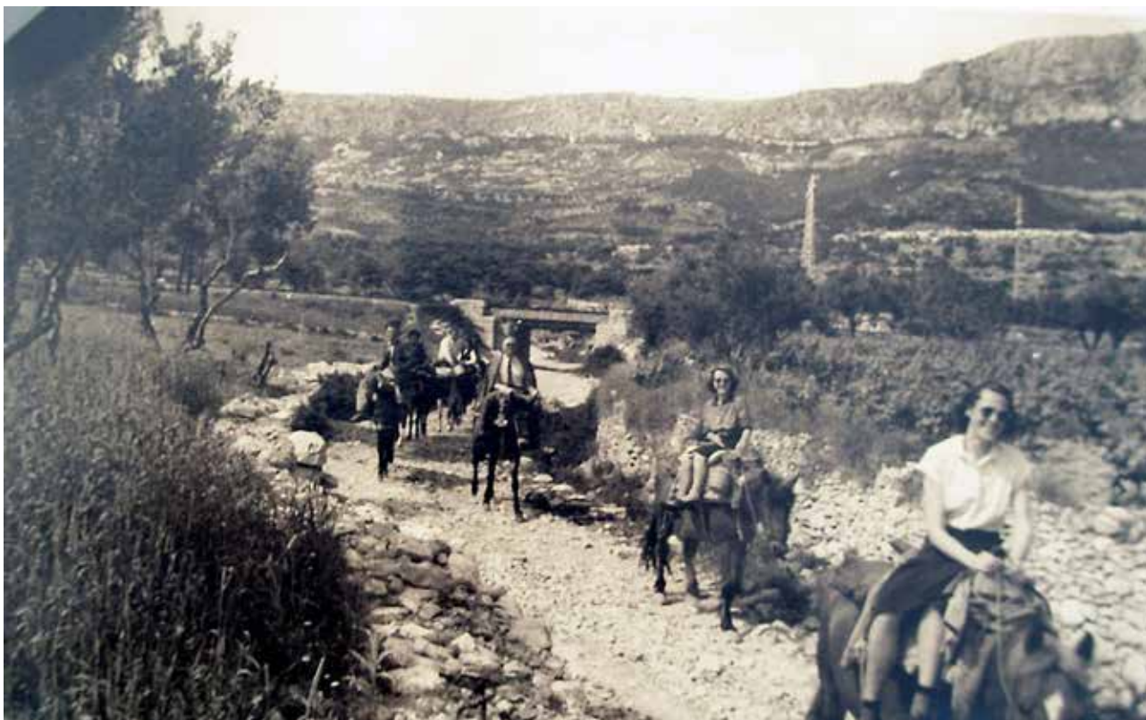
5 Obilazak spomenika na terenu (album pok. N. Bezić Božanić) Field work (album of the late N. Bezić Božanić)

van. 45 Otegotna okolnost bio je i manjak stručnog kadra. 46