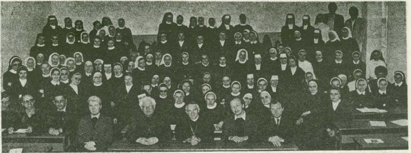
Sudionici tečaja s kardinalom Franjom Kuharićem