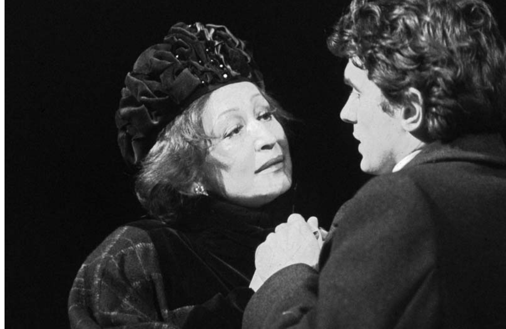
M. Krleža – G. Para: Krležine Zastave , ZKM, 1991.

Miroslava Krleže i u režiji Georgija Para, dok se na ulicama Zagreba nitko nije naročito radovao toj provali demokracije na ruševinama Berlinskog zida. Nebo se bilo prilično smračilo. Predstava se iščekivala mjesecima, kao teatarski nešto veliko što će se dogoditi baš u ZKM-u, koji dotad nije bio specijaliziran za tako velike scenske zalogaše. Naime, bilo je pitanje treba li se ovo kapitalno Krležino djelo odigrati u Hrvatskome narodnom kazalištu ili u ZKM-u; pregovori po načelu treba – ne treba, odvijali su se iza zatvorenih vrata, a onda je negdje u onome jedva vidljivu procjepu između miga tadašnjih političkih struktura i ZKM-ove autsajderske želje za nečim velikim, ipak odlučeno da to bude kazalište u Teslinj 7. Ono što je međutim bilo ključno jest trenutak kada je predstava izvedena, u odnosu na temu koja se kao mutna rijeka provlači kroz pet knjiga ovog orijaškog Krležina romana. A ta tema smo naravno bili mi – na ovom komadiću zemljine kore – Hrvati, Srbi i ostali, koji se već stoljećima, osobito posljednjih stotinu godina, gombamo kako da riješimo svoje međusobne odnose. Naravno, izmjenjivali su se ratovi, revolucije i prevrati, nacionalni zanosi i ideološka