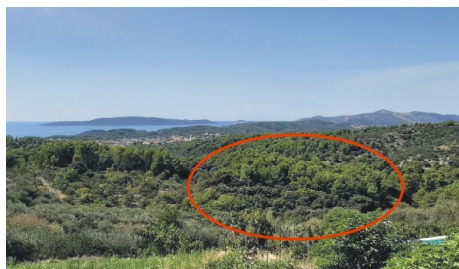
Slika 1. (autor: Ante Jurić)

nosi na „krug”, isti bi se kontekst mogao izraziti i prijevodom »zemlju na brežuljku crkve sv. Mavra«, jer se crkvice doista nalazi na okruglastome brežuljku, na južnoj kosi drage koja u svojem dnu završava uvalom Mõvarčica (slike 1 i 2 prikazuju brežuljak s crkvicom sv. Mavra).