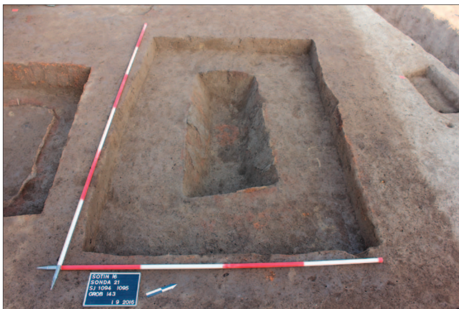
Sl. 4 Sotin – Vašarište, istočna nekropola grob 143